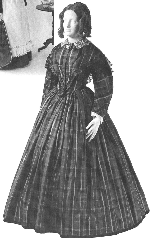
Alle Kostüme aus der Sammlung des Schweizerischen Landesmuseums in Zürich.