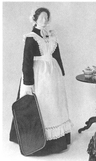
▷△ Dienstmädchenbekleidung, gegen Ende des 19. Jahrhunderts.