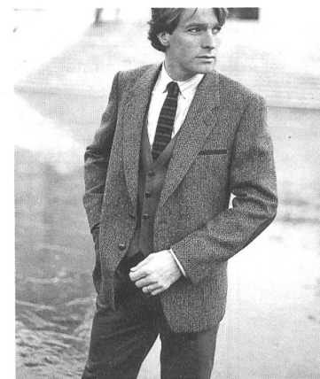
Unter dem Motto «oversized» der superweiche «Pulloverveston» aus locker gewobener Schurwolle, dazu Baumwoll-Hose und Gilet. (Truns Tuch- und Kleiderfabrik)

«Stürmisch und turbulent» ging es nach Aussage von I.G.-Herrenmodepräsident Hans C. Eggenberger am ersten Tag der schweizerischen HAKA-Messe im TMC zu und her. In grosser Zahl waren die Fachbesucher erschienen, um sich auf den Ständen der 60 Aussteller über die Herrenmode Herbst/Winter 1983/84 zu orientieren. Erstmals vermittelte auch eine gut besuchte Video-Show im Foyer des TMC Trendinformationen in Wort und Bild. Danach wird der modische Mann im nächsten Winter viel Leder und Lederapplikationen tragen; er wird Wollsakkos zu Baumwollhosen kombinieren und sich öfters als bislang einen Hut aufsetzen. Materialmix, Farbmix und Accessoires sind wichtige Elemente der neuen HAKA-Mode. Die Schweizer Aussteller haben sich auf den modebewussteren Konsumenten eingestellt mit komfortabel geschnittener Citybekleidung in «Hunting»-Farben und fantasievoller Sportswear in Nebeltönen. Bleibt zu hoffen, dass die Anstrengungen in der Stoffkreation und im Stylingdesign dem HAKA-Markt neuen Auftrieb geben. Er hat es bitter nötig, denn im vergangenen Jahr hat sich der Verdrängungswettbewerb noch verschärft. 1982 sind die schweizerischen HAKA-Einfuhren um 7,8% (aus der BRD um 10%) gestiegen, die schweizerischen HAKA-Ausfuhren um 18,5% (nach der BRD um 23,8%) gesunken. Mit einem Anteil von 31% bleibt die Bundesrepublik