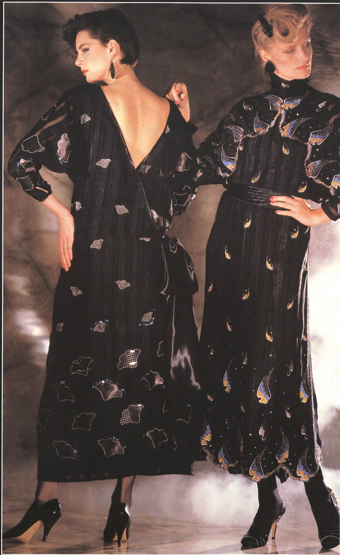
JACOB ROHNER AG, REBSTEIN