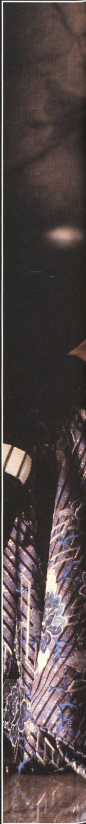
JACOB ROHNER AG, REBSTEIN