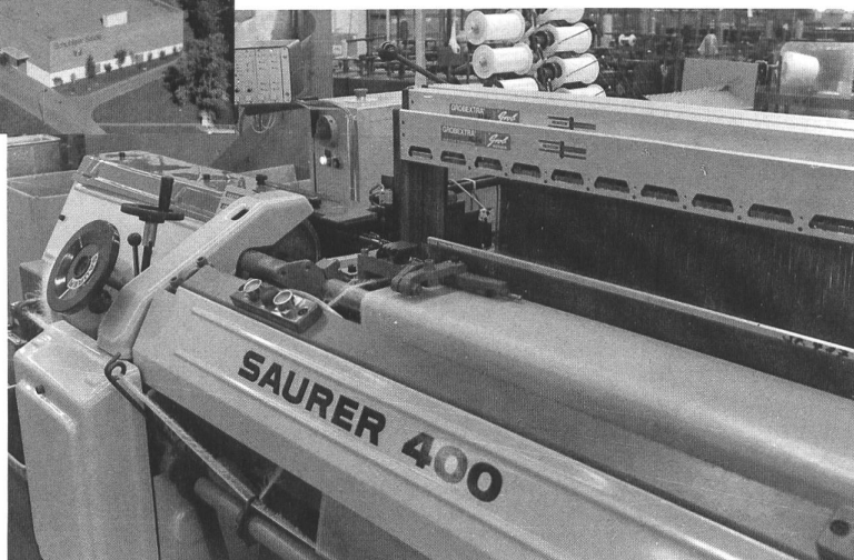
Neueste Greifermaschinen von Saurer wie diese werden im grossen Websaal in Kaltbrunn nach und nach die Schifflisthühle ersetzen, was eine Investition von ungefähr 6 Mio. Franken erfordert.