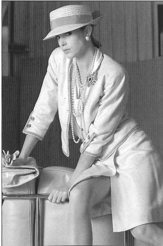
CHANEL CREATION Tailleur Surah