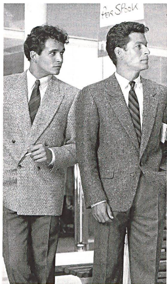
Moderner, auf ein Knopfpaar geschlossener Zweireiher aus Wolle/Alpaca-Tweed und modischer Kurzveston aus Vielfarbentweed.

Auf dem Inlandmarkt verbesserte sich die Lage gegen Ende 1983. Diese Entwicklung wird durch die Zunahme der Kleinhandelsumsätze um nominal 4,5% und die Verflachung der Importe belegt. Die einheimischen Hersteller konnten demnach ihren Marktanteil nicht nur halten, sondern