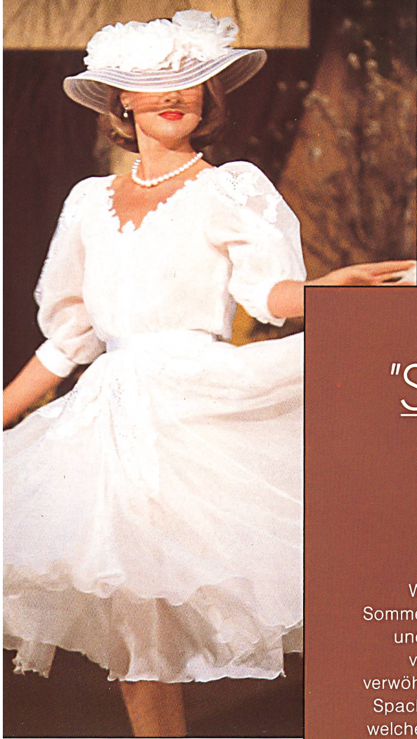
◁ JACOB ROHNER AG, REBSTEIN Kurzes, beschwingtes Sommerabendkleid mit bestickten Tüllinkrustationen, bereichert mit Satin-Applikationen und Strass.