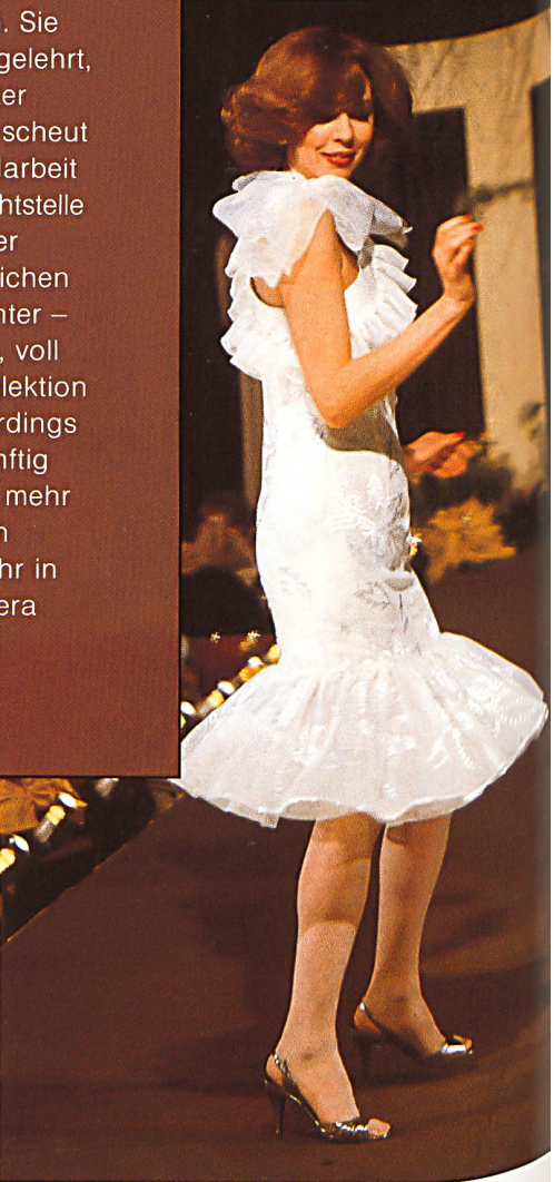
A. NAEF AG, FLAWIL ▷ Kurzes, beschwingtes Tanzkleid aus Reinseidencrêpe mit Stickerei in Seide und Lurex.