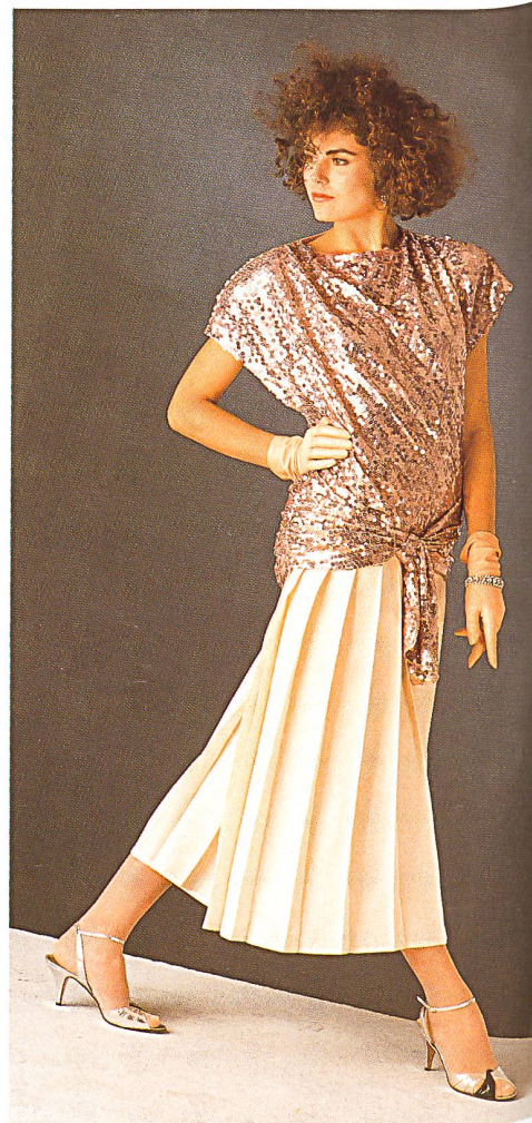
JAKOB SCHLAEPFER+CO. AG, ST. GALLEN △ Paillettenbesticktes Top mit Hüftdrapé / Top brodé de paillettes et drapé aux hanches / Top with sequin embroidery and hip drape. Mod. Marc Kehnen, Duisburg