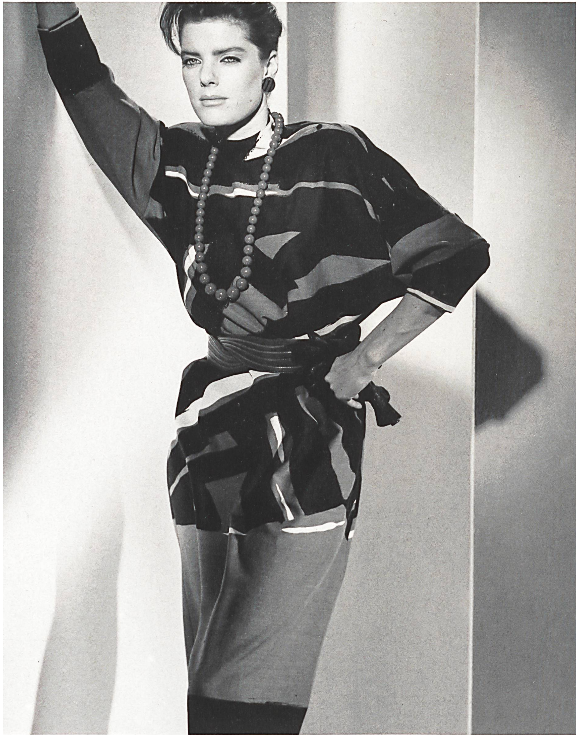
METTLER + CO. AG, ST. GALLEN – Robe imprimée en pure laine «Lariana» / Bedrucktes Tageskleid aus reiner Wolle «Lariana» / Day dress in pure wool print «Lariana». Mod. Gérard Pasquier, Paris