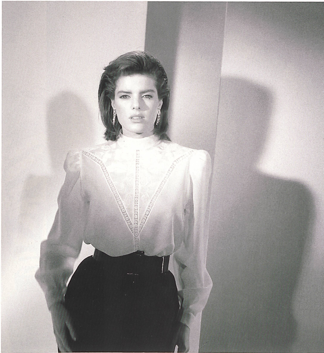
BISCHOFF TEXTIL AG, ST. GALLEN – Importante broderie rayonne sur empècement à motif, bordure chimique, en crêpe polyester / Grossflächige Kunstseidenstickerei auf Motiveinsatz mit Ätzabschluss, Polyester-Crêpe / Rich rayon embroidery on motif insert with burnt-out edging, polyester crêpe. Mod. Muriel Céalac, Paris