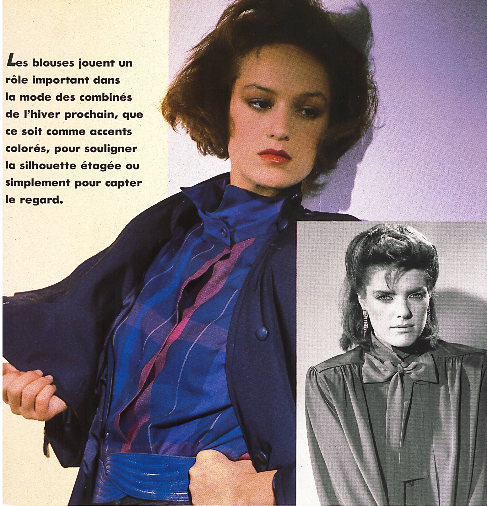
METTLER + CO. AG, ST. GALLEN — Blouse très féminine à empiècement aux épaules et col noué en polyester «Polana» / Feminine Bluse mit Schultergöller und Kragenschleife aus Polyester «Polana» / Feminine blouse with straight yoke and bow in polyester «Polana». Mod. Bleu Marine Design, Paris ▷

Les blouses jouent un rôle important dans la mode des combinés de l'hiver prochain, que ce soit comme accents colorés, pour souligner la silhouette étagée ou simplement pour capter le regard.