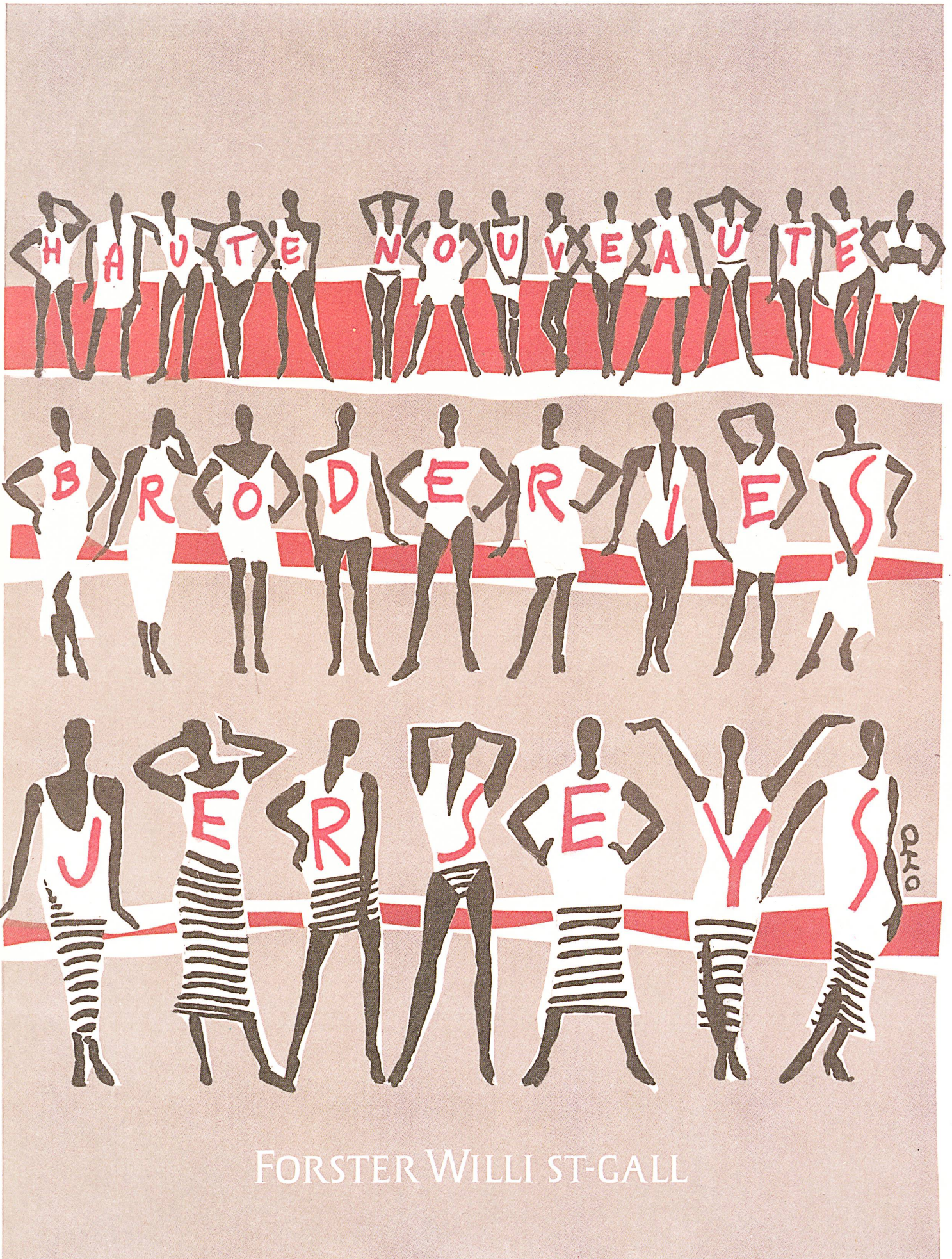
FORSTER WILLI ST-GALL