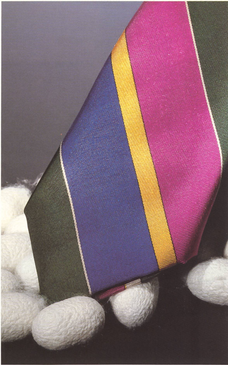
Streifen-Muster in eleganter Farbstellung aus der Kollektion Weisbrod-Zürrer AG, Hausen a. A.