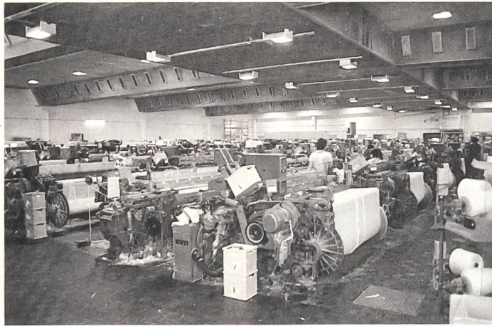
Blick in die Weberei mit modernsten Luftdüsen-Maschinen.

Neuzeitlichere Marksteine der bewegten Firmengeschichte waren: der Neubau der Weberei Uster im Jahr 1962, die Umwandlung der Kollektivgesellschaft in eine Aktiengesellschaft 1976. Dann folgte im Jahr 1978 der Bau des neuen zentralen Spinnereivorwerks und 1985 der Einsatz neuester Luftdüsen-Webmaschinen. Trotz der stolzen