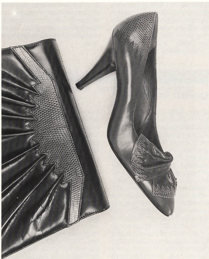
Eleganter Pump aus Chevreau mit aparten Applikationen aus Reptilleder und schlankem, 7 cm hohem Absatz. Assortiert dazu raffinierte Pochette. Modelle Bally International.

Trotz der modischen Aktualität der Kollektionen, trotz der schönen Qualitäten und der perfekten Verarbeitung der Schuhe ist es für die Firma nicht leicht, im internationalen Wettbewerb Schritt halten zu können. Die massiven Währungsschwankungen des Dollars und des englischen Pfundes bringen empfindliche Verzerrungen, und auch der Touristenstrom in der Schweiz ist zurückgegangen, die Kaufkraft der Ausländer gesunken. Dass man jedoch keine Anstrengungen scheut, durch Kreativität und Qualität das Interesse der Konsumentenschaft zu wecken und die Kauflust anzureizen, beweisen die neuen Modelle für Herbst/Winter 86/87.