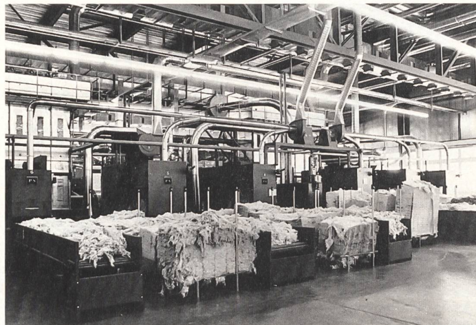
Auf Baumwolle spezialisiert...