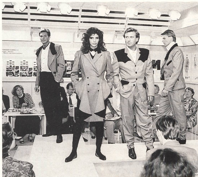
Im Rahmen der 50. Herren-Mode-Woche zeigte das Trevira-Studio interessante und vieldiskutierte Designer-Vorschläge.

Feinfädige Ware, zu der reine Zwirne, aber auch attraktive Mischungen mit Viscose, Leinen oder Baumwolle zählten. Blau/Grau und verschiedene Grautöne waren die gefragtesten Farben, die sich in dezenten farbigen Streifen oder ebenso zurückhaltenden Glenchecks präsentierten. Bei Einzel-Vestons reichte die Skala von Seide bis zu modifiziertem Crash-Look und bis zu feinen Strukturen. Blaugrundige Farben dominierten. Interessant auch Fantasie-, Glencheck- und