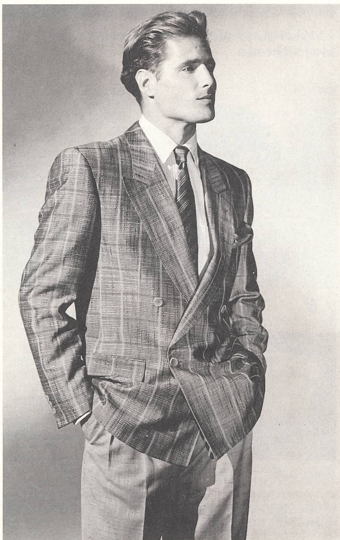
Modischer Zwei-Reiher auf ein Knopfpaar zu schliessen. Bundfaltenhose. Stoff: Bleiche AG, Zofingen.

an der Nachfragebelebung zu partizipieren. Der HAKA-Export hat im ersten Halbjahr um 16% zugenommen, während sich die Einfuhren lediglich um 3% erhöhten. Wichtigster Abnehmer für die Schweizer Herrenbekleidungs-Industrie bleibt die Bundesrepublik Deutschland mit einem Anteil von 41%. Nach den an der TMC-Monsieur gemachten Erfahrungen äusserten sich die beteiligten Schweizer Hersteller mehrheitlich positiv. In den ersten 6 Monaten des laufenden Jahres hat sich die Beschäftigungslage in der schweizerischen Bekleidungsindustrie weiter verbessert. «Am stärksten dazu beigetragen hat die Herren-