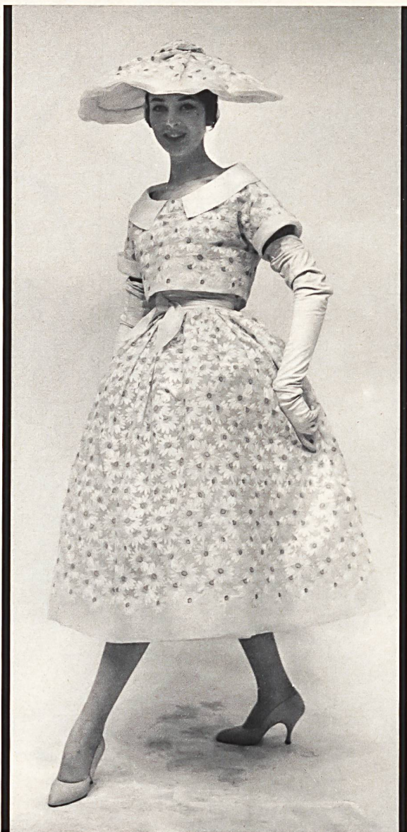
BRODERIE ALLOVER SUR ORGANZA DE A. NAEF