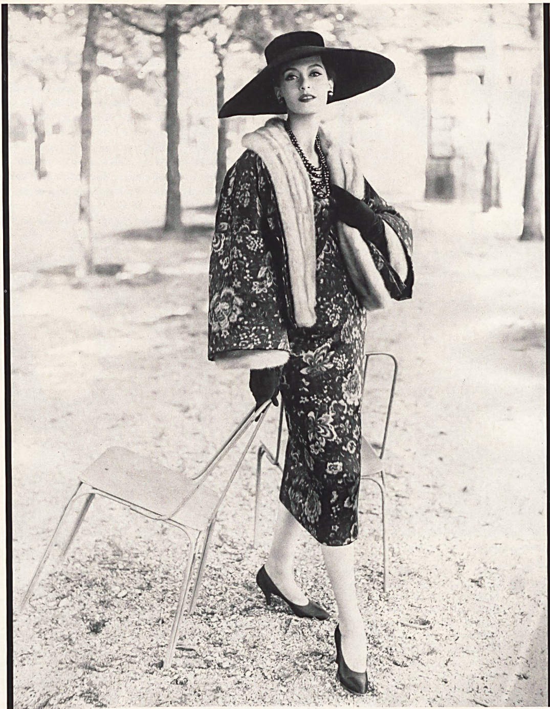
OTTOMAN CHINÉ DE ABRAHAM

New Look. Ces mots ont fait le tour du monde à la vitesse d'une traînée de poudre. Le nouveau «look» de ce nouveau créateur était en effet une révolution, une transformation radicale de l'apparition féminine, un événement qui fit d'un jour à l'autre ou presque, d'un obscur styliste le nouveau monarque de la mode parisienne.