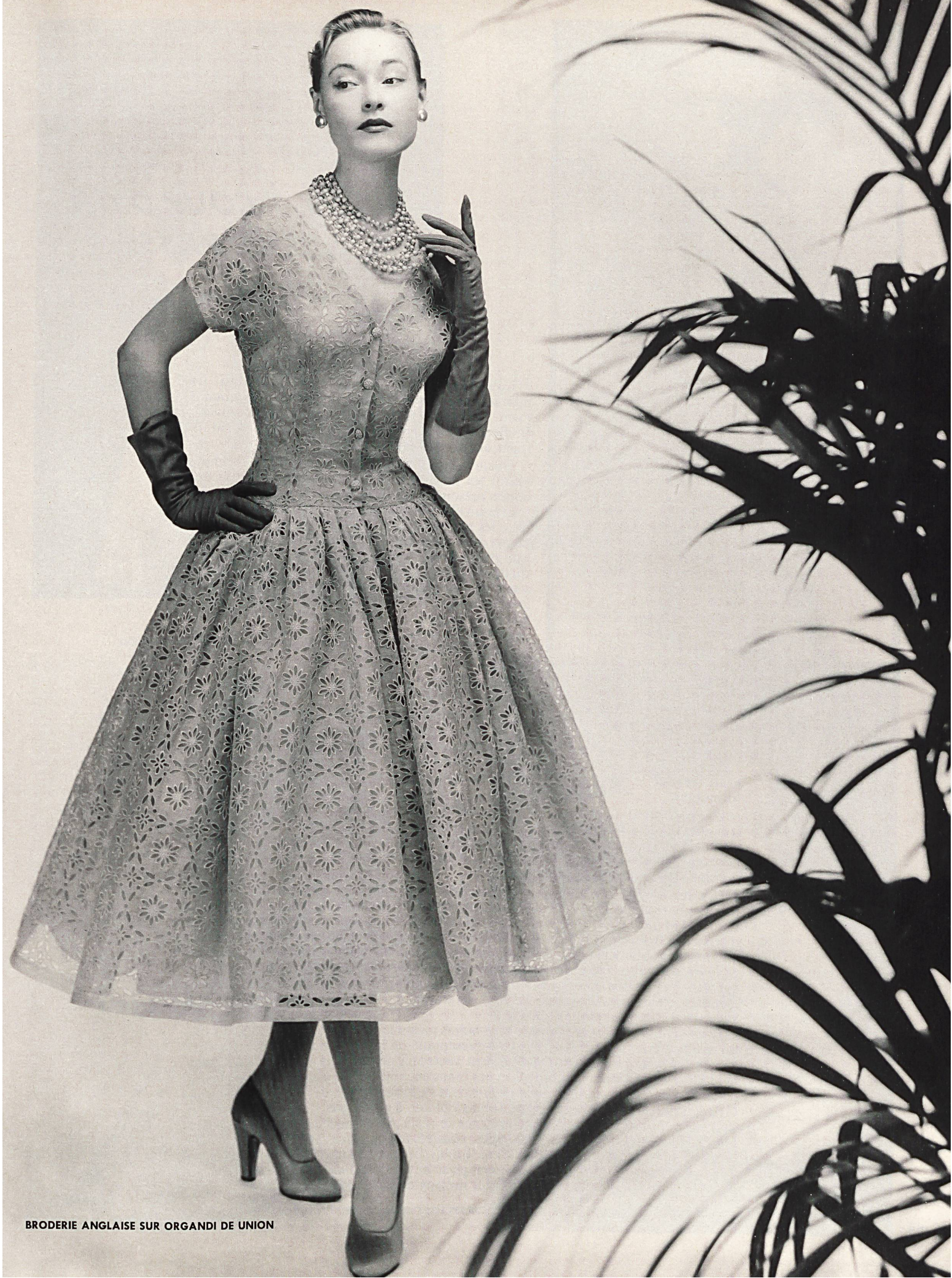
BRODERIE ANGLAISE SUR ORGANDI DE UNION