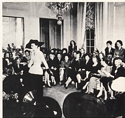
L'INSTANT – HISTORIQUE – DE LA NAISSANCE DU NEW LOOK