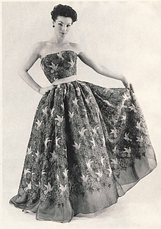
BRODERIE ALLOVER SUR ORGANZA DE A. NAEF