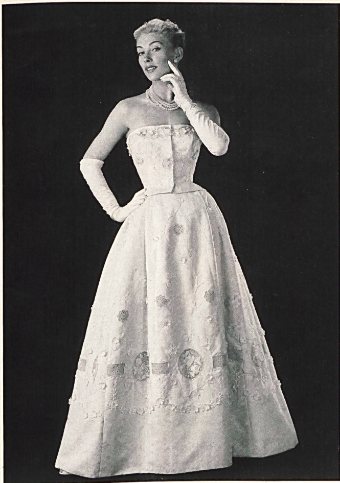
BORDURE BRODÉE DE UNION