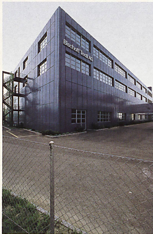
DER NEUBAU IN ST. GALLEN-KRONBÜHL

Gerade nur fünf Prozent der Stickereiprodukte fliessen in den Schweizer Markt, 95 Prozent gehen in den Export. Hauptabnehmer sind Wäschehersteller, Hauptabsatzgebiet ist Westeuropa. Die Verkaufsaktivitäten sind jedoch weltweit zu sehen, in London und New York über eigene Verkaufs-