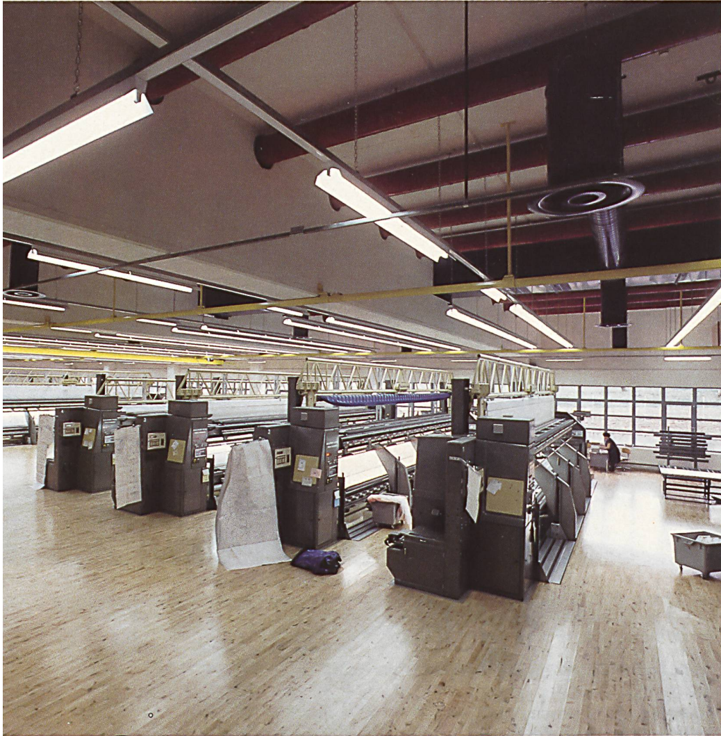
ELEKTRONISCHE MUSTERERFASSUNG (BIFOMAT)