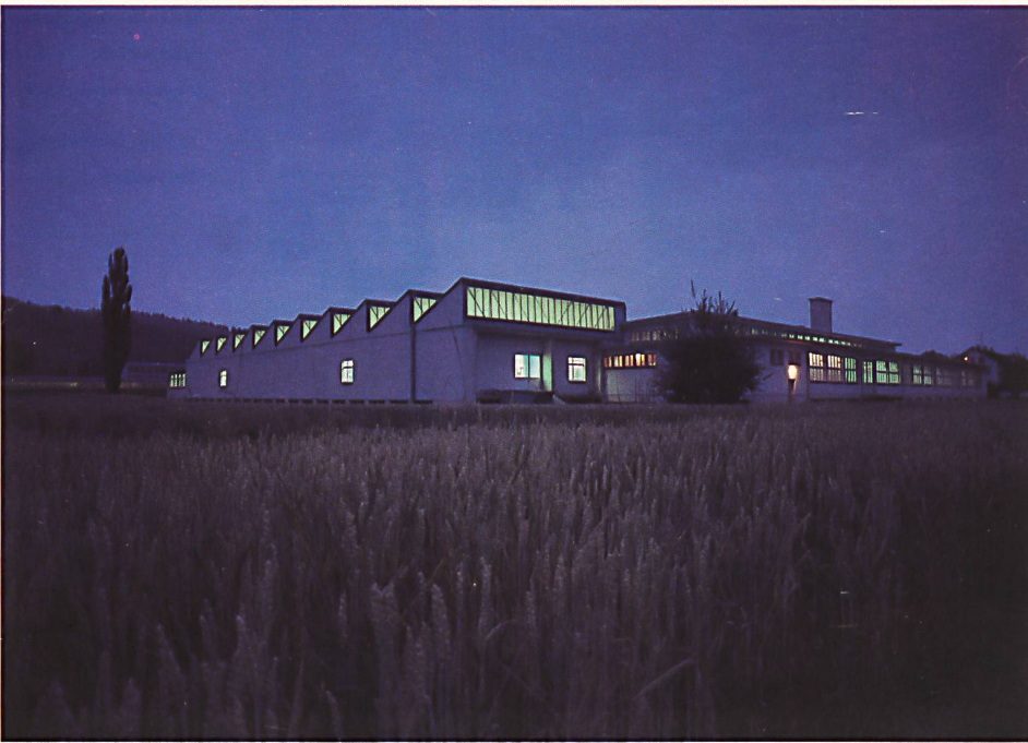
Das Geschäftsgebäude der Bally Band AG in Schönenwerd