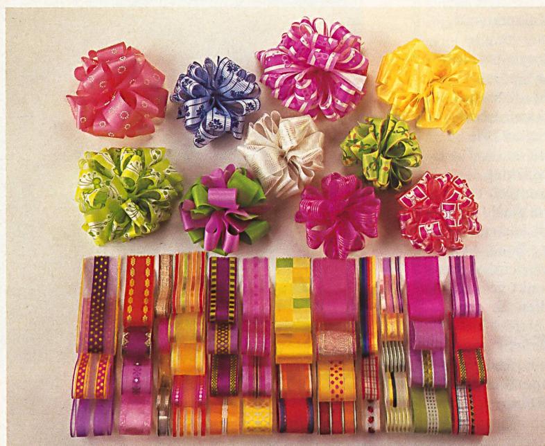
Aus der Produktpalette: Etiketten, Dekorationsbänder, Reissverschlussbänder