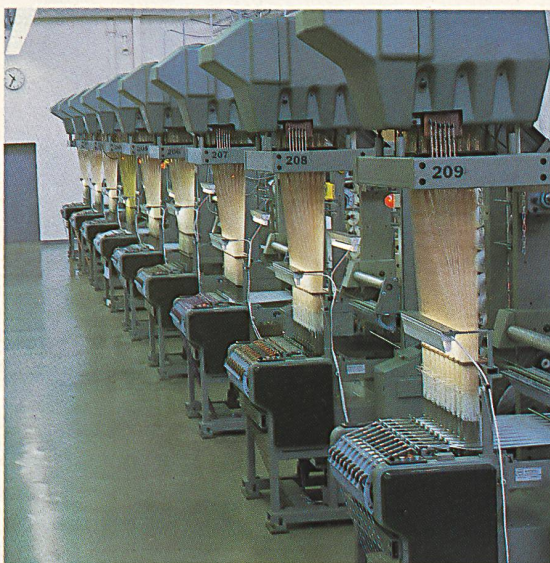
Etiketten-Fabrikation mit neuen Nadelautomaten