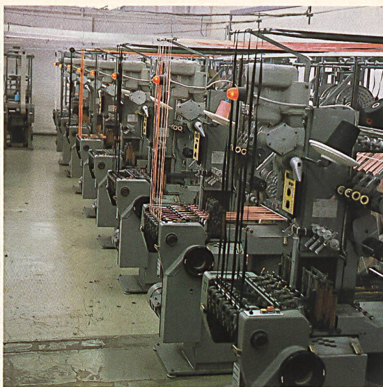
Müller Bandweb-Automaten der neuesten Generation

Was sich in der Spinnerei und Weberei in den letzten Jahren schritt- und etappenweise entwickelte, kam in der Bandweberei fast über Nacht. Das erklärt auch, warum heute sieben Jahre alte Bandwebstühle demontiert und durch eine völlig neue Generation ersetzt werden. Mit einem Investitionsprogramm von über 2 Mio. Schweizer Franken wird eine Total-