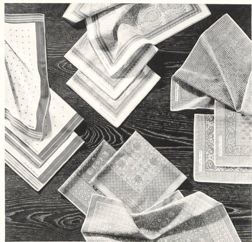
Das bedruckte Herrentaschentuch – eine Neuheit von Christian Fischbacher Co. AG, St. Gallen.

Die kleine, in sich abgerundete Kollektion von bedruckten Herrentaschentüchern umfasst vier Dessins in drei Farbstellungen, von feinen Tupfen mit dekorativem Rand bis zum Bordüreindruck oder einer subtilen Kaschmirabwandlung. Es handelt sich um ein hochwertiges Baumwolltuch in einer Grösse von 44 cm. Der feine Schweizer Batist ist im Handdruckverfahren dessiniert. Die Farben sind harmonisch auf die aktuelle Männermode abgestimmt: Silbergrau, Beige, Lodengrün, Bordeaux und Petrol.