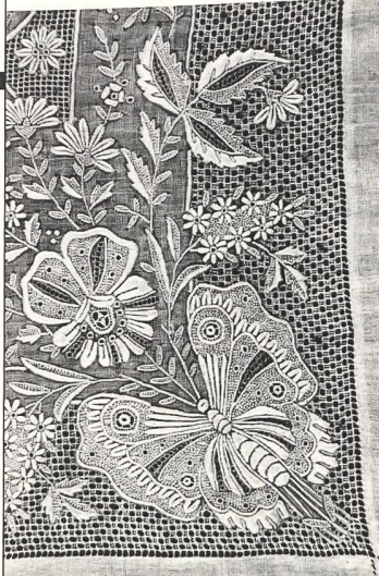
Handstickerei auf Baumwoll-Batist. Appenzell, Ende des 19. Jahrhunderts (Ausschnitt aus Taschentuch).

In der «Grauer-Sammlung», angelegt durch Isidor Grauer, eine führende Persönlichkeit der ostschweizerischen Stickerei-Industrie des späten 19. und des 20. Jahrhunderts, werden ausgewählte Objekte der umfangreichen Sammlung präsentiert, die 1983 dem Textilmuseum St. Gallen geschenkt wurde. Darunter sind einige der ersten Spitzen-Taschentücher, reine Luxus- und