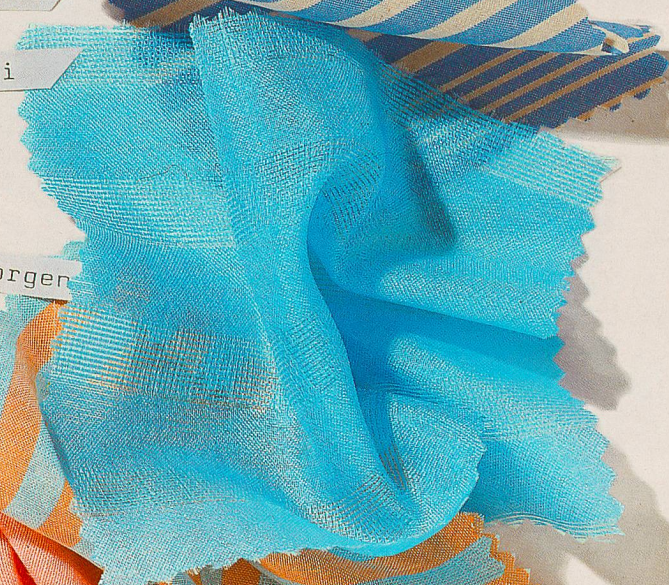
Albrecht + Morgen