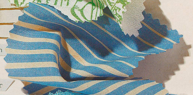
Eugster + Huber