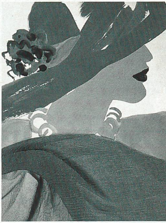
Titelbildgestaltung von Mouchy mit Stoffen von Stehli Seiden AG