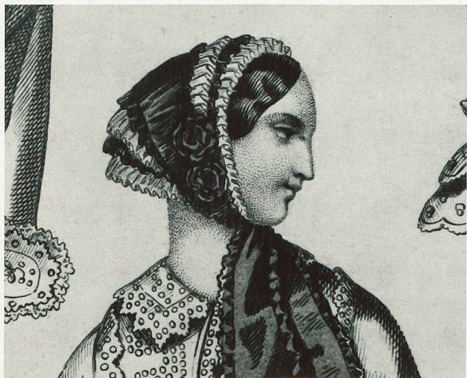
Kupferstich-Detail aus «Petit Courrier des Dames», Paris, 1853.

Mit Wechselausstellungen zu jeweils relativ eng gefassten Themen will das Textilmuseum St. Gallen auf ganz verschiedene Aspekte seiner umfangreichen und überaus wertvollen Sammlung hinweisen. Unter dem Motto «Kopf und Kragen» steht die Ausstellung 1992, die anhand von Hauben und textilem Halsschmuck einen Eindruck von Weissstickereien des ausgehenden 18. bis zum 20. Jahrhundert vermittelt.