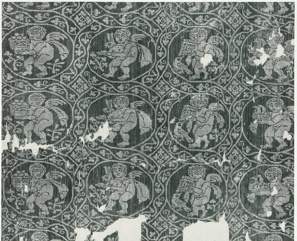
Fragmente einer seidenen Tunika mit Eroten. Abegg-Stiftung, Riggisberg.