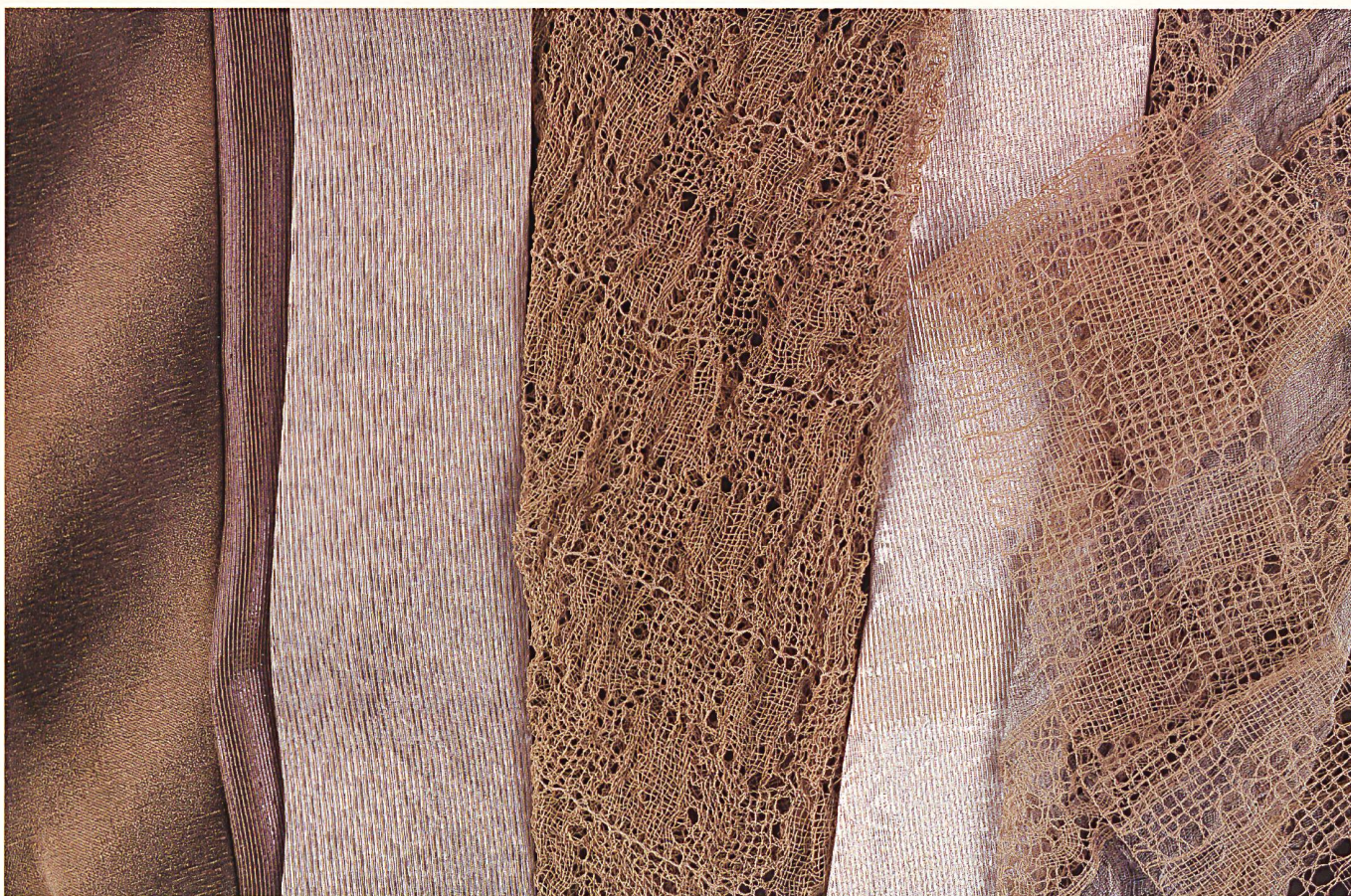
Neuentwicklungen aus Papiergarnen, teils gemischt mit Seide und Metallgarnen, von Schlaepfer.

tasie wachsen überall Flügel. Ausserdem: «Man muss sich bewegen in diesem Beruf, stets neugierig und offen sein – aber mit einer gewissen Distanz und Ironie». Die geruhssame Ostschweizer Textilstadt bringt die Distanz, Beschaulichkeit fördert die ironische Betrachtung, und Reisen in die Zentren der Mode ist Bewegung, Belebung, Konfrontation.