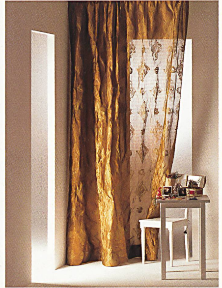
Dekorationsstoffe. Kreation Martin Leuthold und Bernhard Duss, Designteam Schlaepfer. 2. Preis Kategorie «Textil-Produkte», Design Preis Schweiz 95.