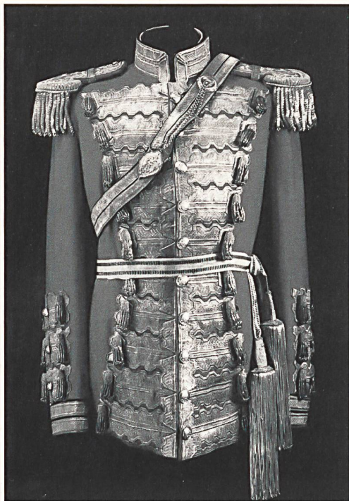
Uniform eines höheren Offiziers am Kaiserhof in Wien

Der Kaiserhof in Wien war im letzten Jahrhundert einer der Mittelpunkte im europäischen Mächtespiel. Aber nicht nur politisch, sondern auch kulturell gab die Hauptstadt des Habsburger-Reiches – vor allem der Kaiserhof – den Ton an. Das Palais Galliera, Museum für Mode und Kleidung in Paris, widmet daher in Zusammenarbeit mit dem Kunsthistorischen Museum der Stadt Wien der «Kleidung am Wiener Hof 1815–1918» eine eigene Ausstellung, die noch bis 3. März 1996 zu besichtigen ist.