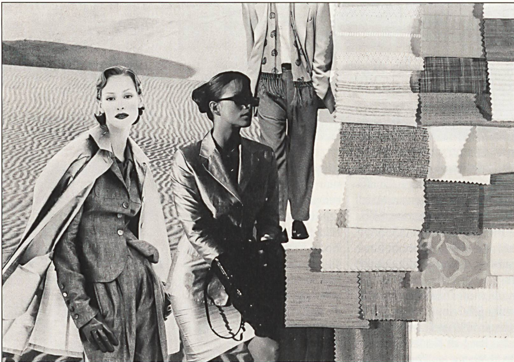
Trendthema «Les femmes des dunes» von Rhône-Poulenc

«Plein Eté» sprüht vor Farben und neuen Stoffideen wie Kaschiertem, Bondiertem, Prägungen, Pig-