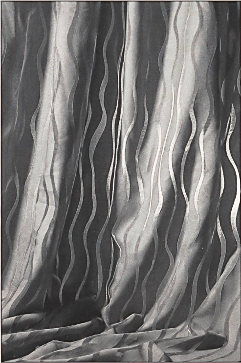
Anerkennung Kategorie «Textil» Produkte: «Move» vom Design-Team Creation Baumann, Langenthal