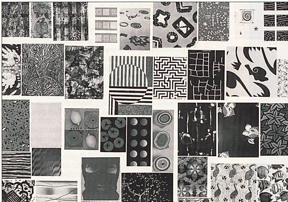
Dessinierungstrends von Rhône-Poulenc

Als Trendaussage werden acht Themen lanciert: «Desert» mit körnigen Strukturen und hellen Beige/Braunnuancen; «Burnt» erinnert an Angesengtes oder Verbranntes; «Lava» mit Rot-/Braunnuancen bevorzugt neue Weboptiken; «Timeless» brilliert in kargem Hell/Dunkelkontrast mit minimalistischen Mustern; «Engraved» in edlen Neutrals gewinnt durch subtile feine Oberflächenveränderungen, die an Architektur und reliefartige Dessins erinnern; «Foam» gemahnt mit Pastells und kräftigen Farben an semitransparente «schaumige» Strukturen. «X-Ray» verbindet kühles Weiss mit kräftigen Farben und weichen, griffigen Dessins. «Liquid» schliesslich lässt an Öltropfen, veränderte Oberflächen, Rippen und neue Jacquards denken.