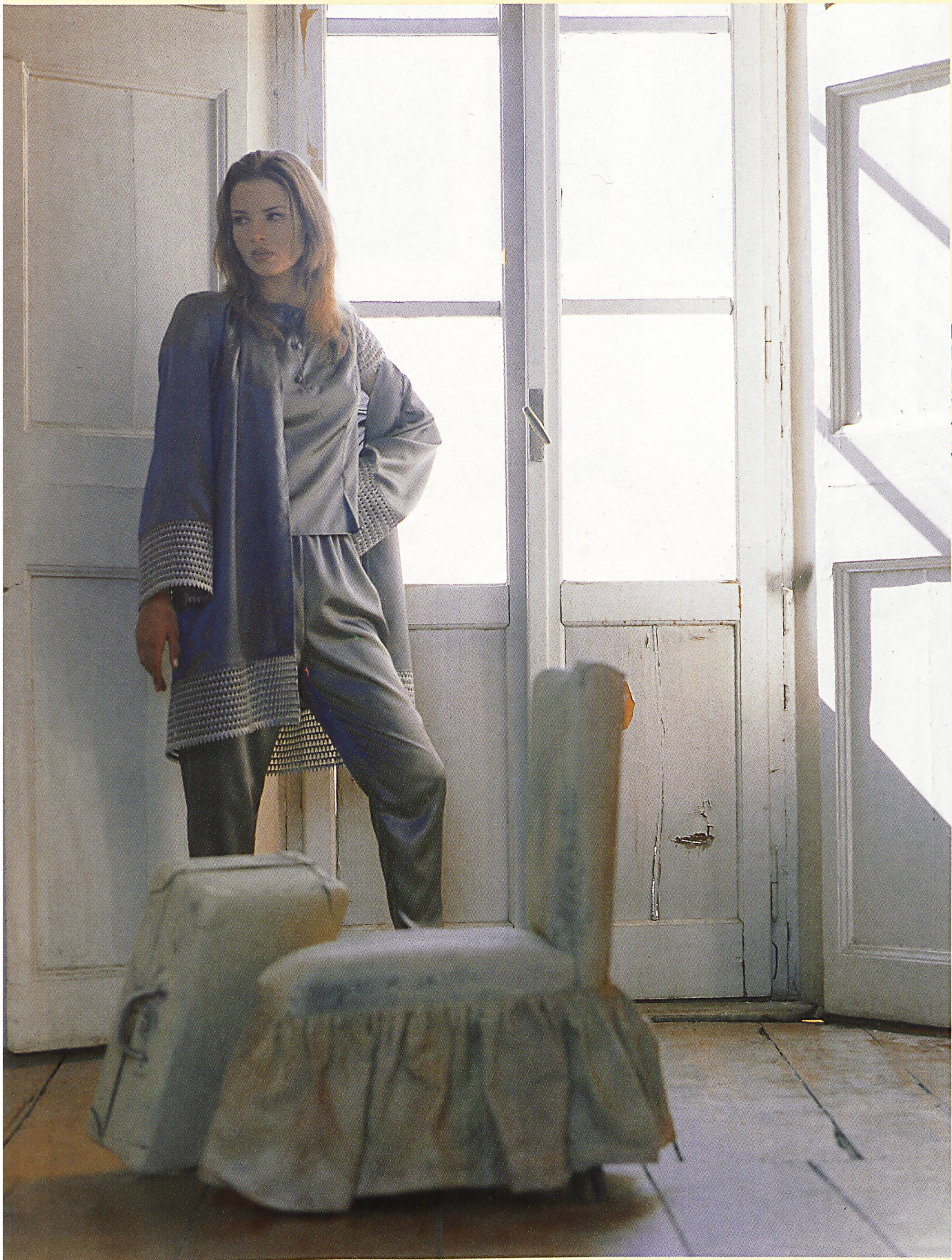
BANDINI MIT BORDÜREN- STICKEREI AUF SATIN VON BISCHOFF