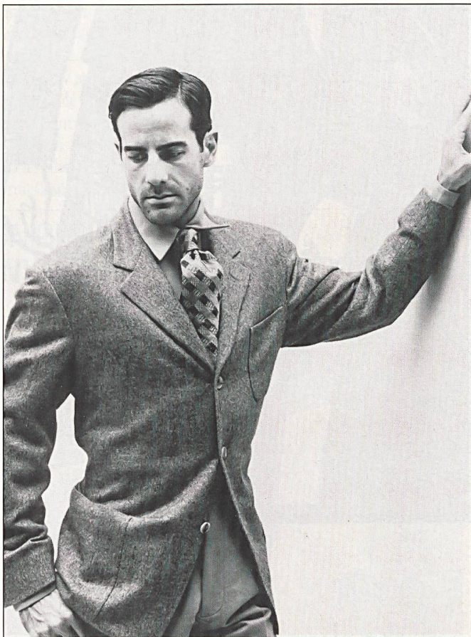
Stretch in Cashmere – knapp geschnittenes, aber pulloverbequemes Veston von Zegna.

Natürlich manifestiert sich die propagierte neue Eleganz, trotz vorherrschenden Grautönen, nicht in der steifen Korrektheit des konventionellen Anzugs. Manchmal wird sie mit etwas Ironie ins Dandyhafte gewendet, manchmal bekommt