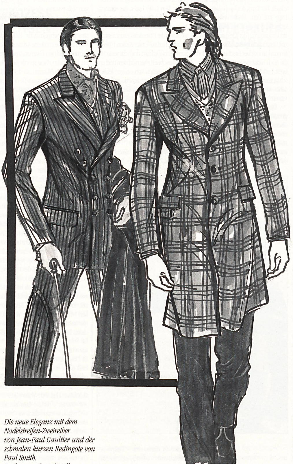
Die neue Eleganz mit dem Nadelstreifen-Zweireiher von Jean-Paul Gaultier und der schmalen kurzen Redingote von Paul Smith. Zeichnung Christel Neff.