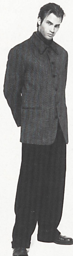
Die schmale, hochgeschlossene Silhouette – kombinierter Anzug von Mondo di Marco.

Besinnung auf sichere Werte charakterisiert die qualitativ eher hoch bis top angesiedelte Männermode, wie sie für das Angebot am Pitti Immagine Uomo in Florenz bezeichnend ist. Mann ist auf einen ziemlich seriösen Eindruck und eine moderne kühle Eleganz bedacht, die italienisches Temperament zugunsten eines zu-