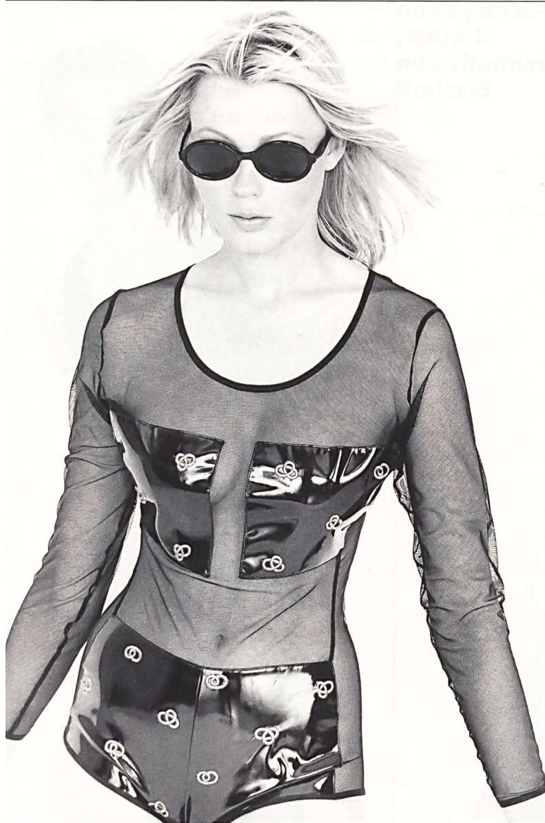
Elastische Allover-Stickerei auf Laqué von Bischoff