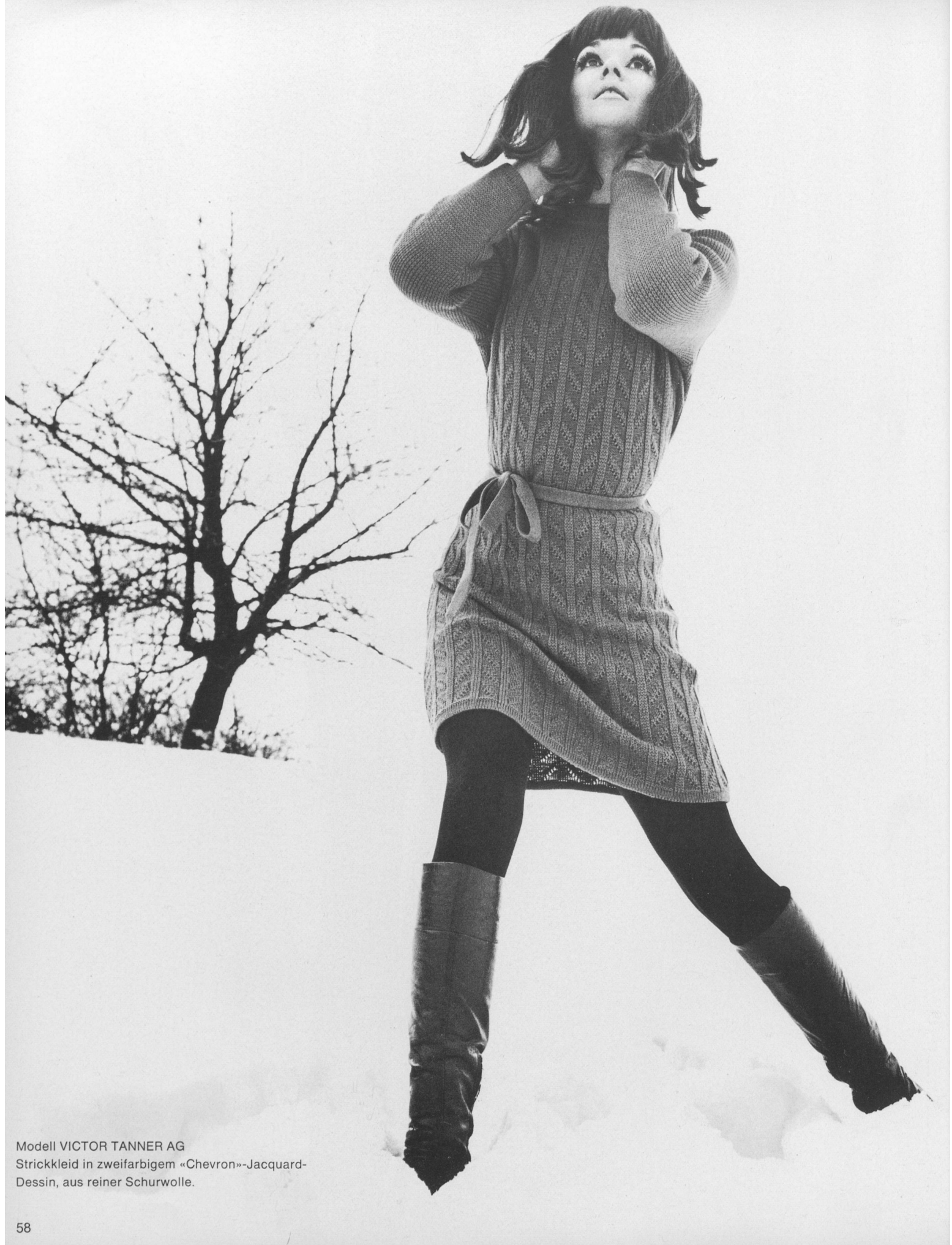
Modell VICTOR TANNER AG Strickkleid in zweifarbigem «Chevron»-Jacquard- Dessin, aus reiner Schurwolle.