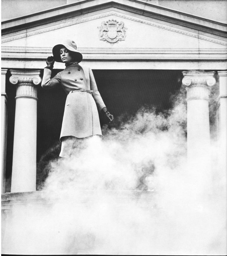
36 PATRIC S.A. Mantel Jersey PATRIC, reine Schurwolle, aus der Kollektion WOOL TRENDS INTERNATIONAL