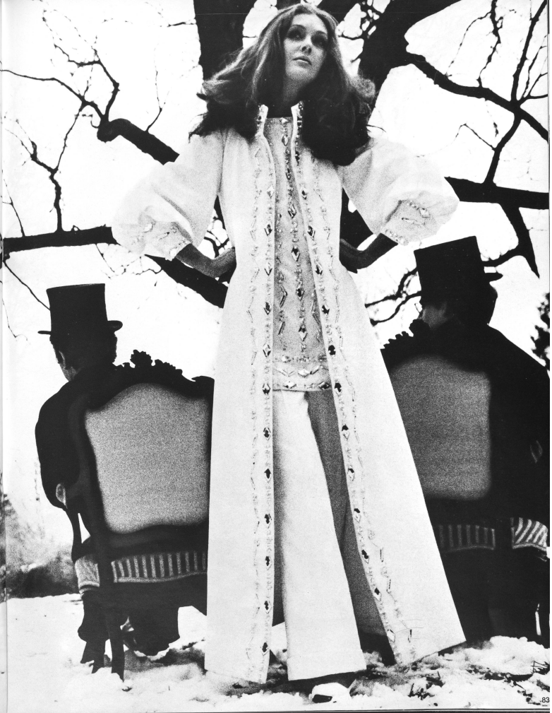
82 GACK-MODELLE Fashions today: Tersuisse® evening pantsuits. (Fabrics: Stünzi Sons Ltd., 8810 Horgen)