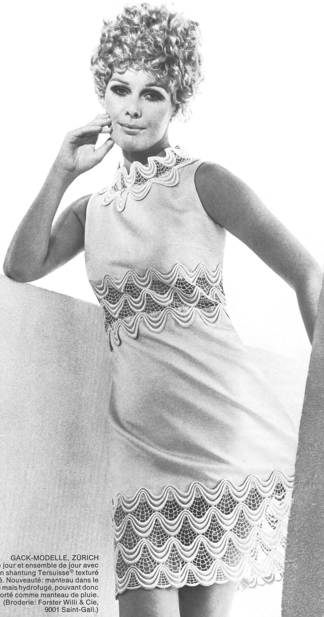
GACK-MODELLE, ZÜRICH Robe de jour et ensemble de jour avec manteau en shantung Tersuisse® texturé brodé. Nouveauté: manteau dans le même tissu mais hydrofugé, pouvant donc être porté comme manteau de pluie. (Broderie: Forster Willi & Cie, 9001 Saint-Gall.)