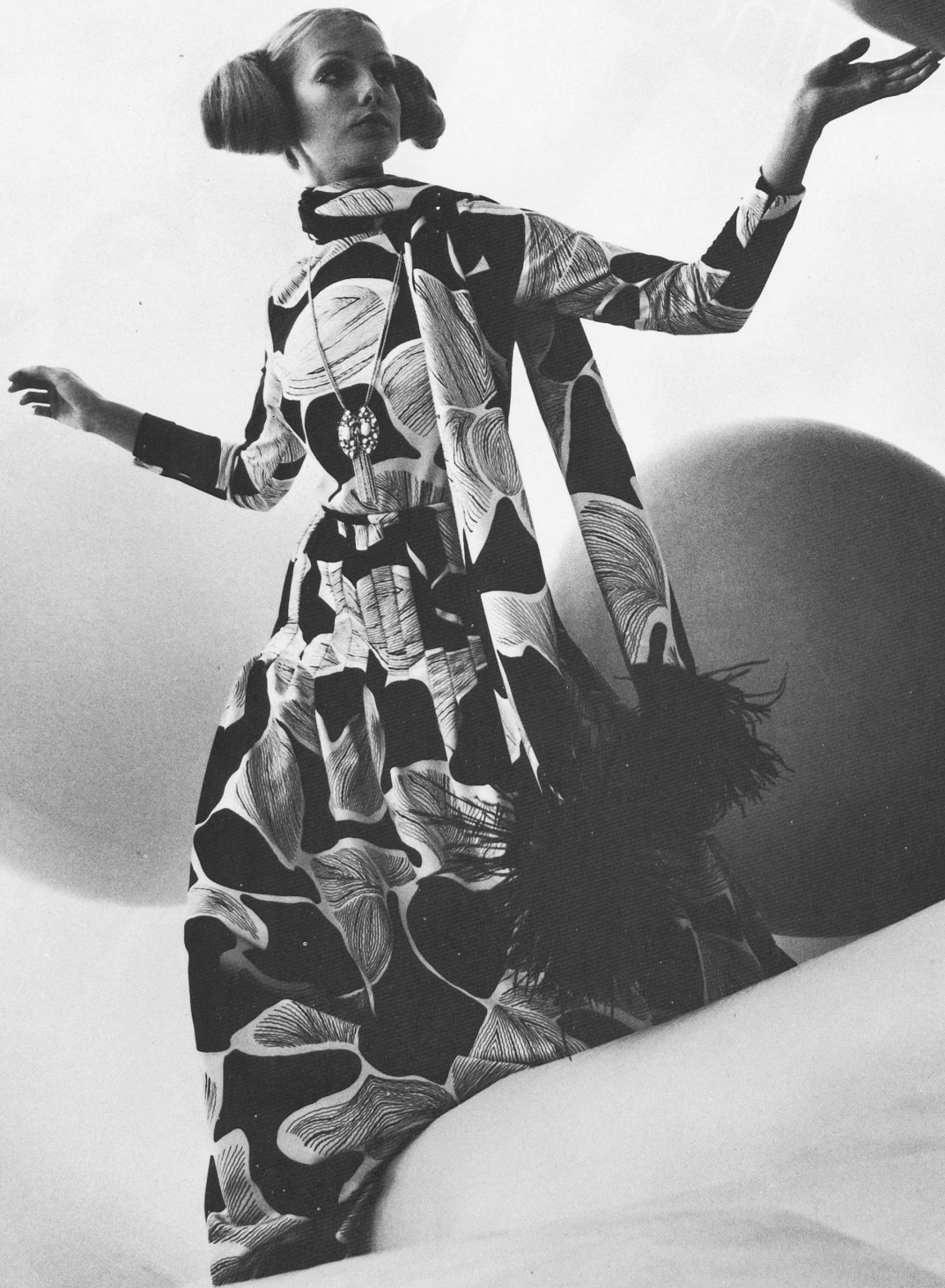
WILLY MEYER AG, ZÜRICH "Gipsy" summer evening dress in black and white print synthetic jersey. 71