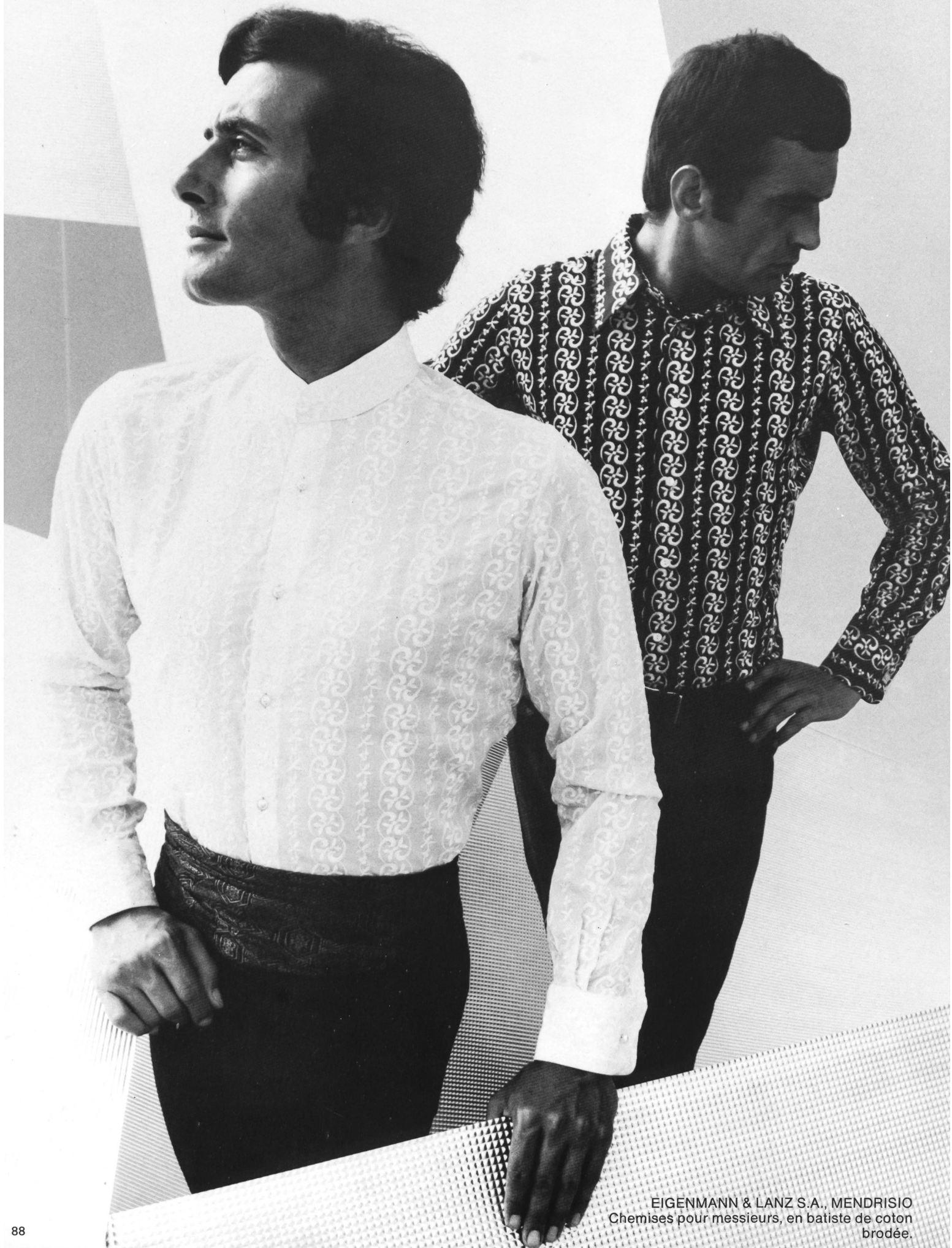
EIGENMANN & LANZ S.A., MENDRISIO Chemises pour messieurs, en batiste de coton brodée.