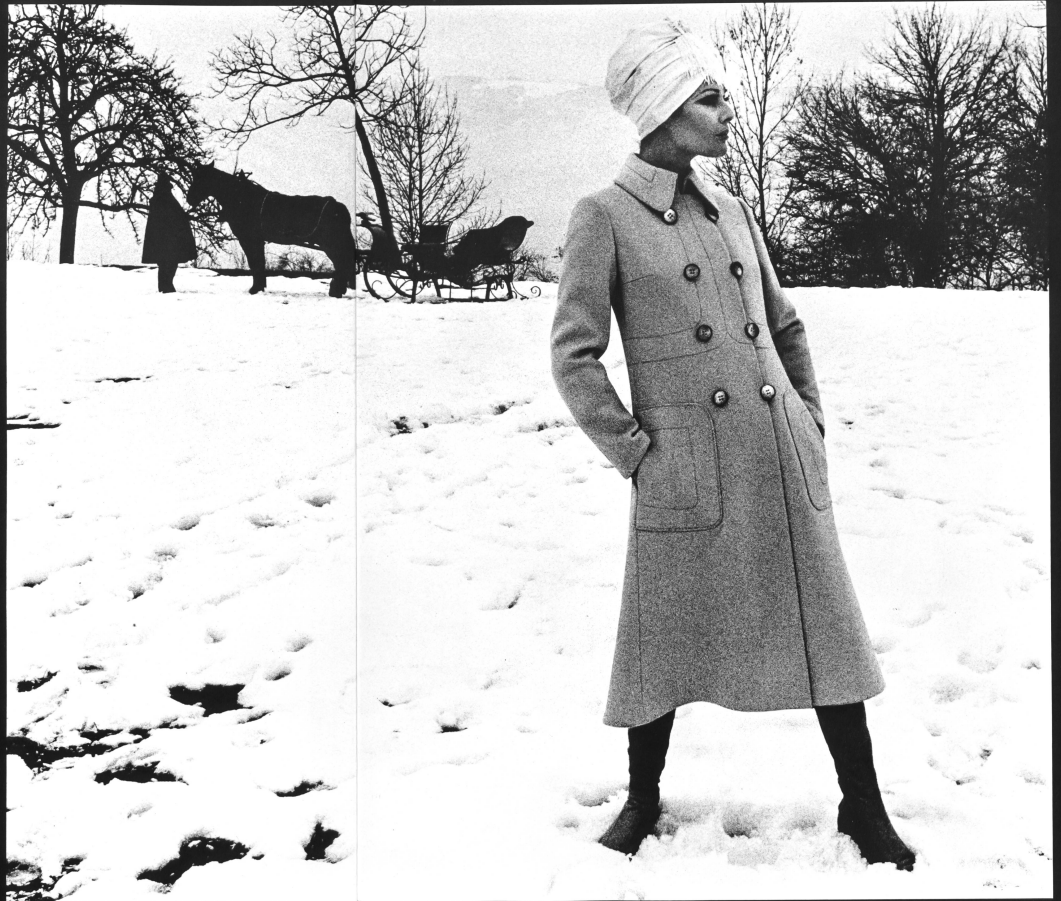
ARTHUR SCHIBLI S.A., GENÈVE Attractive, sporty looking mid-coat, in pure new wool.