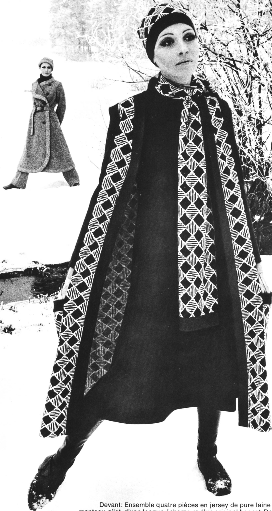
LA MAILLE S.A., LAUSANNE Devant: Ensemble quatre pièces en jersey de pure laine vierge, composé d'une robe maxi, d'un manteau-gilet, d'une longue écharpe et d'un original bonnet. Derrière: Ensemble quatre pièces en tricot de pur shetland chiné, composé de manteau maxi, pull, pantalon et bonnet.