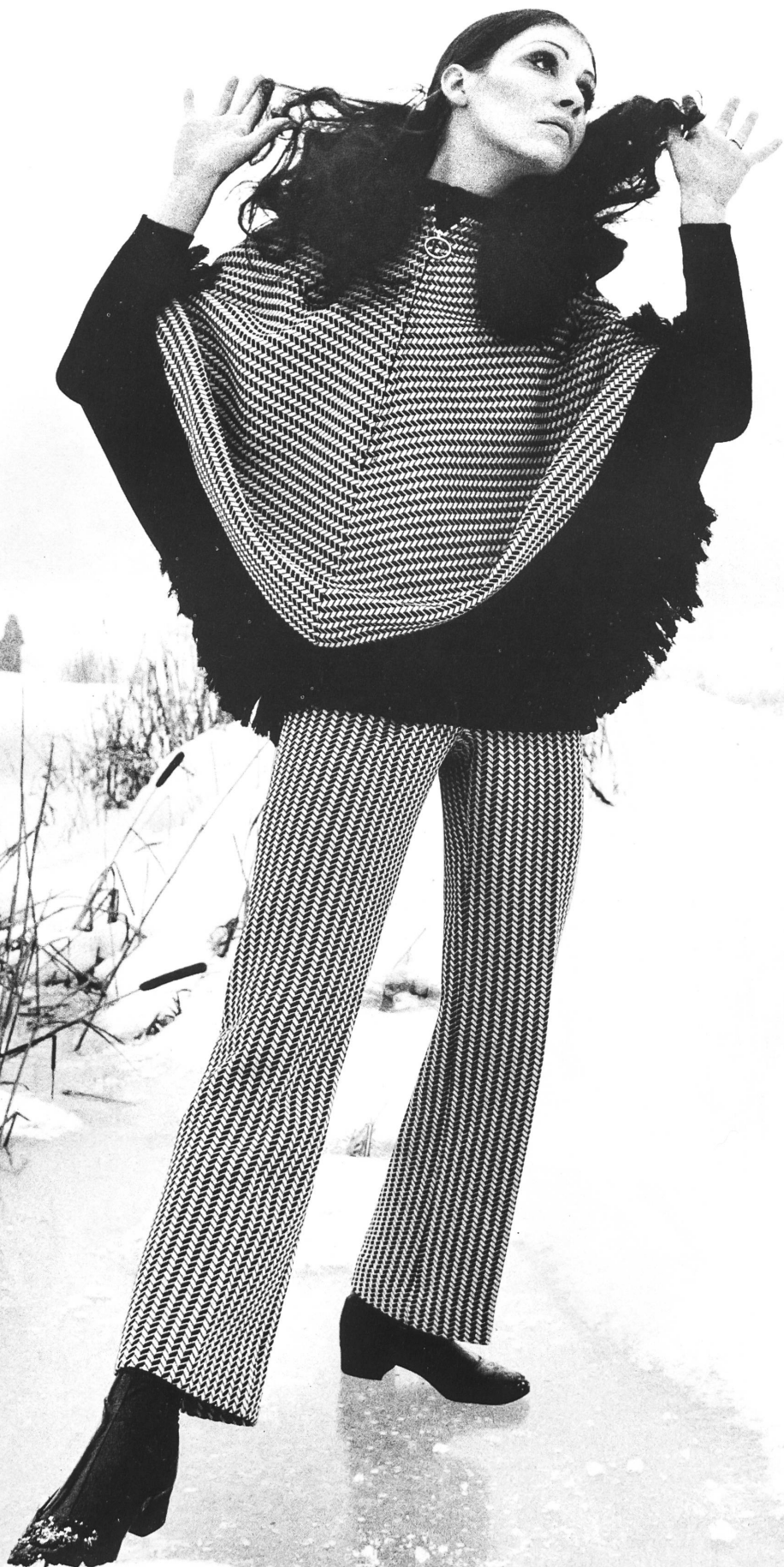
PATRIC S.A., COLOMBIER Ensemble d'après-ski trois pièces en jersey de Tersuisse® et laine, composé de poncho, casaque et pantalon. 25