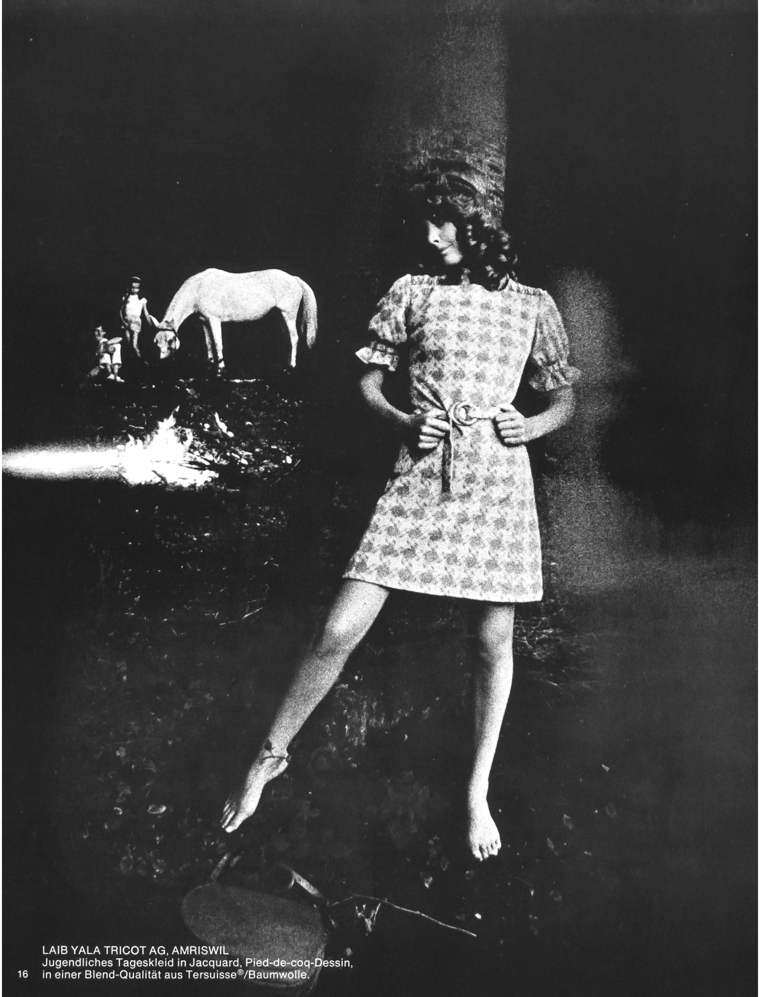
LAIB YALA TRICOT AG, AMRISWIL Jugendliches Tageskleid in Jacquard, Pied-de-coq-Dessin, in einer Blend-Qualität aus Tersuisse®/Baumwolle.