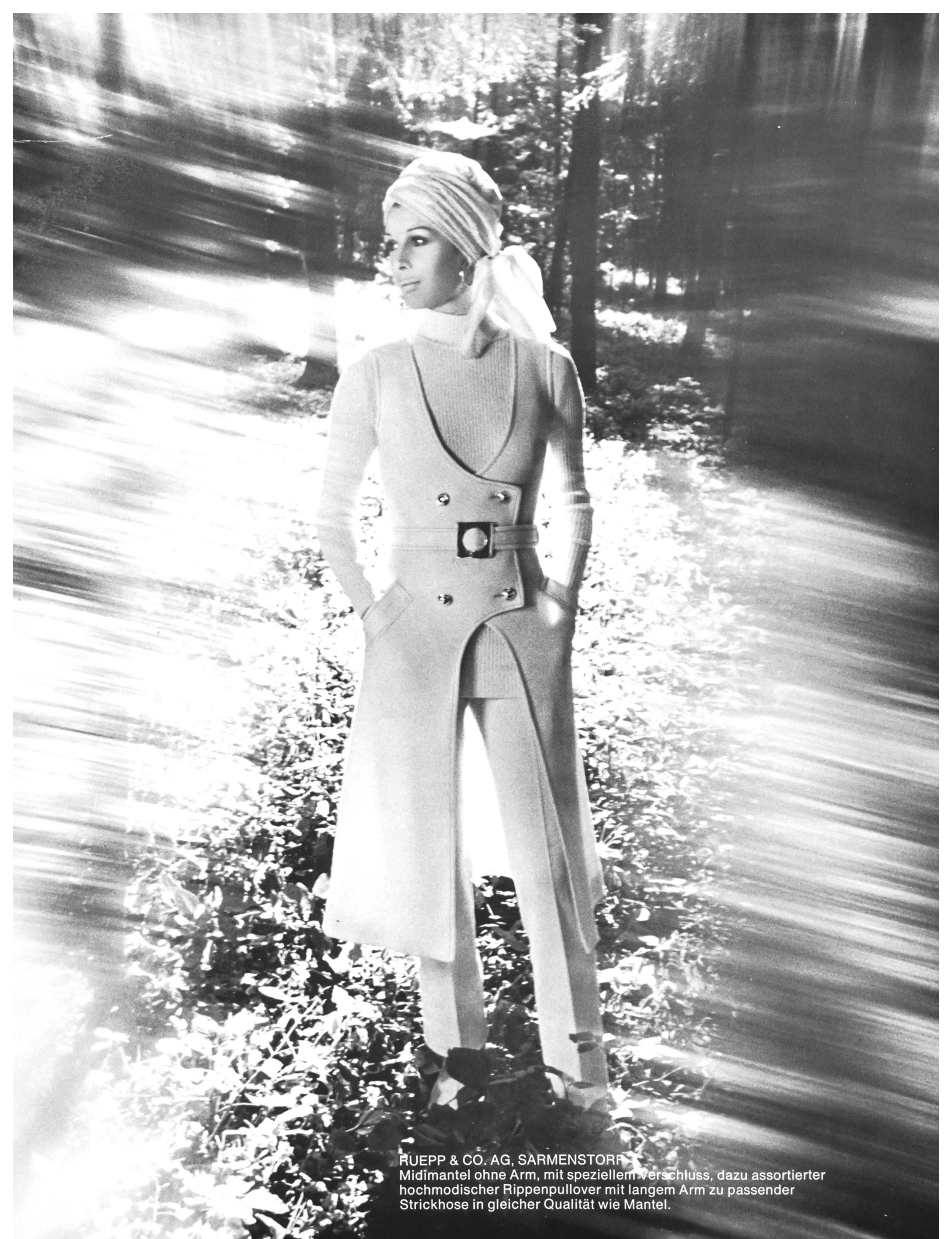
RUEPP & CO. AG, SARMENSTORF Midimantel ohne Arm, mit speziellemverschluss, dazu assortierter hochmodischer Rippenpullover mit langem Arm zu passender Strickhose in gleicher Qualität wie Mantel.