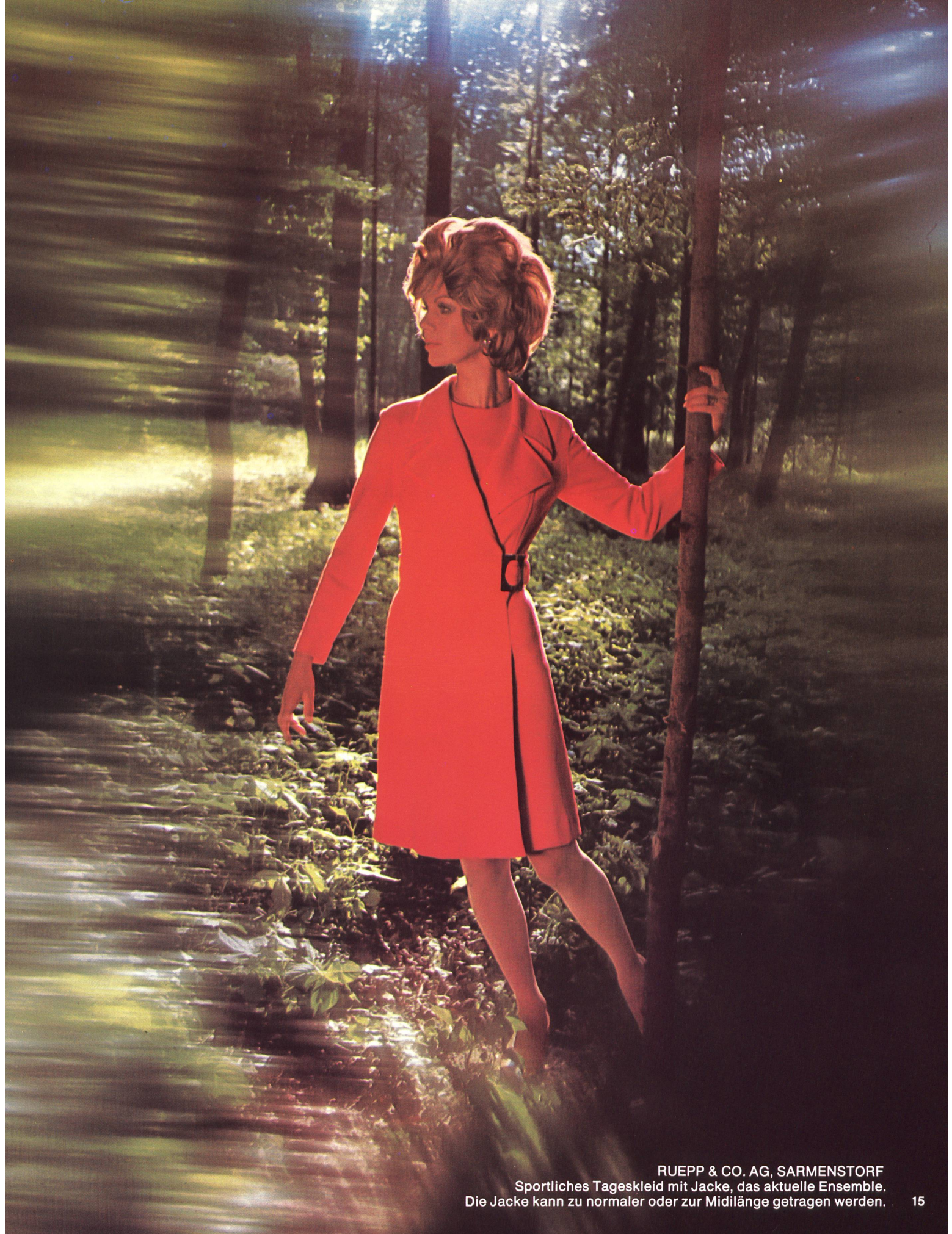
RUEPP & CO. AG, SARMENSTORF Sportliches Tageskleid mit Jacke, das aktuelle Ensemble. Die Jacke kann zu normaler oder zur Midilänge getragen werden.