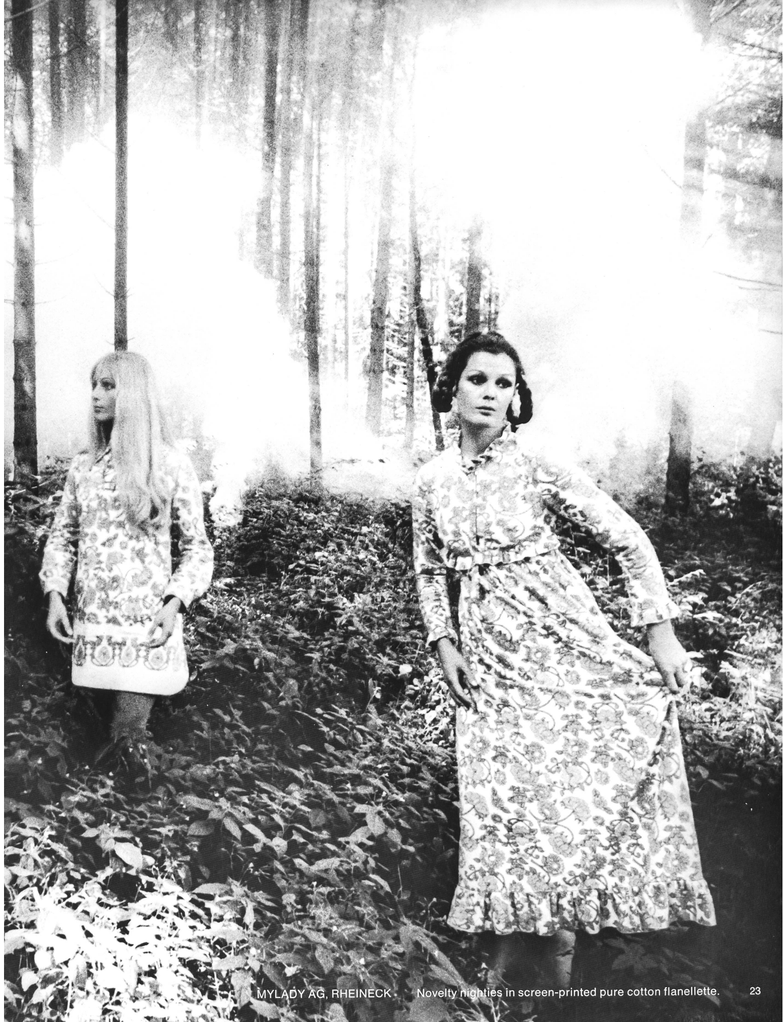
MYLADY AG, RHEINECK Novelty nighties in screen-printed pure cotton flannellette.