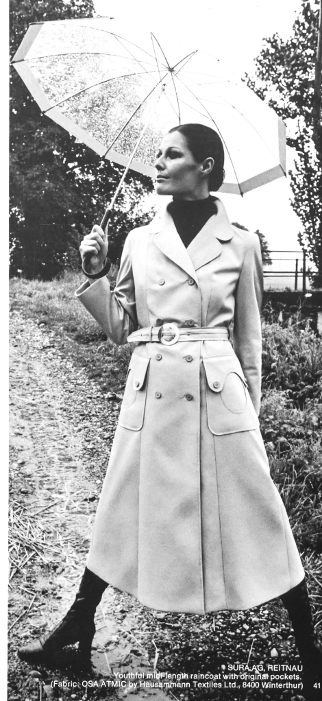
• SURA AG, REITNAU Youthful mid-length raincoat with original pockets. (Fabric: OSA ATMIC by Hausammann Textiles Ltd., 8400 Winterthur) 41