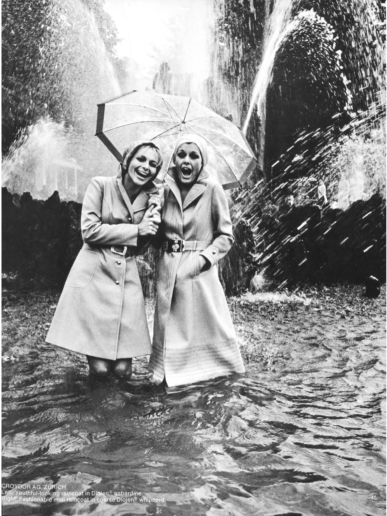
CROYDOR AG, ZÜRICH Left: Youthful-looking raincoat in Diolen® gabardine. Right: Fashionable midi raincoat in coarse Diolen® whipcord.