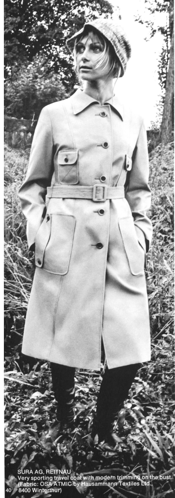
• SURA AG, REITNAU Very sporting travel coat with modern trimming on the bust. (Fabric: OSA ATMIC by Hausammann Textiles Ltd., 8400 Winterthur) 40