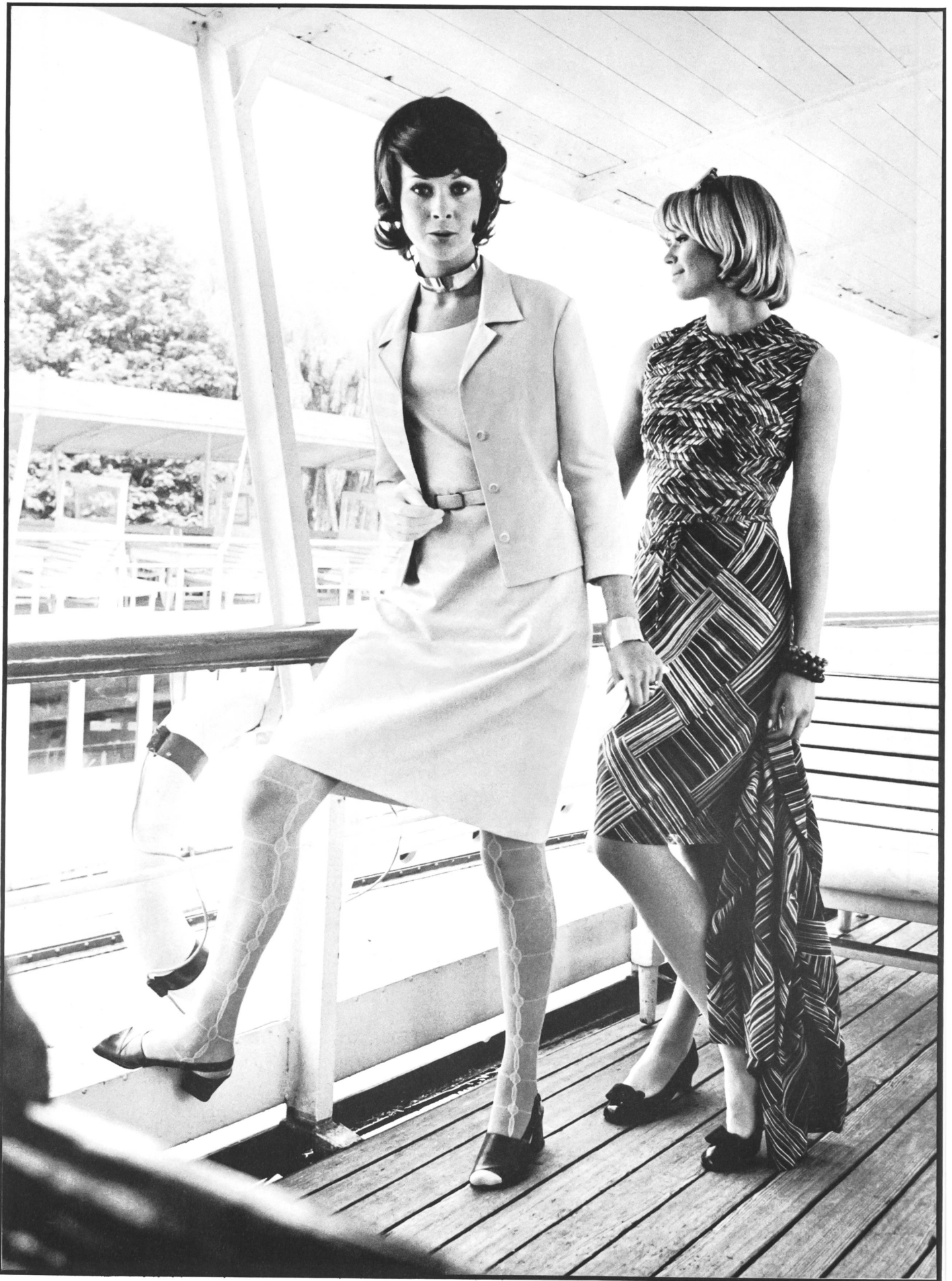
48 WALTER STARK AG, ST. GALLEN Links: Leichtes, elegantes Sommerkleid aus seidenähnlicher Baumwolle. Rechts: Nachmittagskleid mit Jacke, durchgearbeitetes Oberteil, aus dezent bedrucktem, leichtem Baumwoll-Voile.