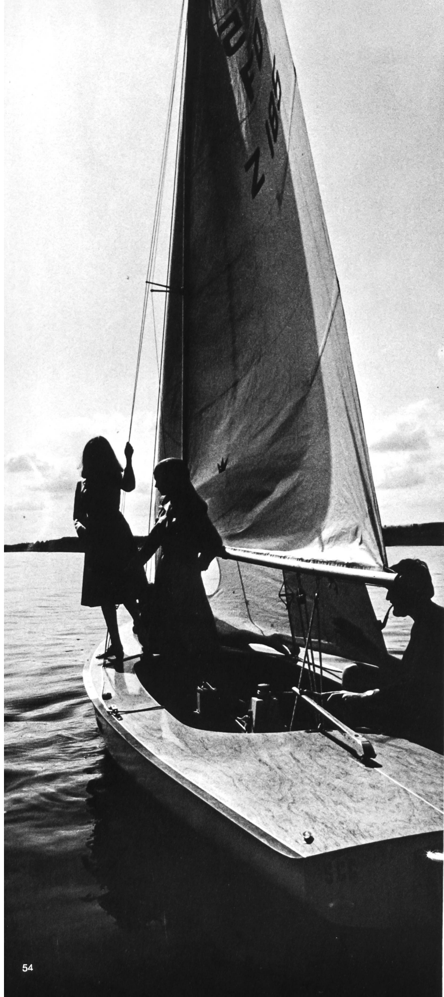
DUMAS + EGLOFF S.A., CHÂTEL-ST-DENIS Links: Regenmantel im Blousonstil, in Tricotine aus Dacron® und Baumwolle. Rechts: Jugendlicher Regenmantel aus Tergal® Baumwoll-Gabardine mit Changeant-Effekt.