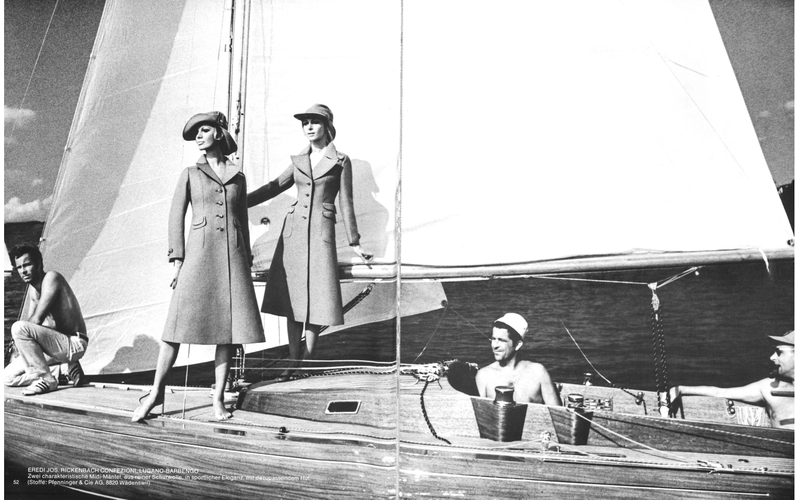
EREDI JOS. RICKENBACH CONFEZIONI, LUGANO-BARBENGO Zwei charakteristische Midi-Mäntel, aus reiner Schurwolle, in sportlicher Eleganz, mit dazupassendem Hut. (Stoffe: Pfenniger & Cie AG, 8820 Wädenswil)