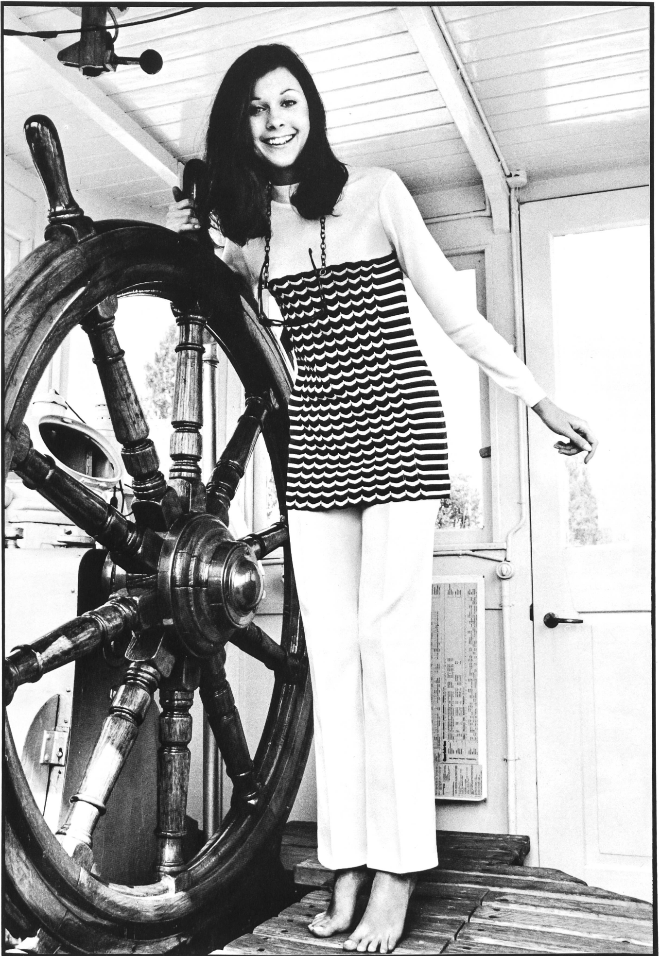
TRICOTERNA AG, ZÜRICH Weisses Hosenensemble aus Dylene® mit aparter blauer und roter Streifengarnitur.