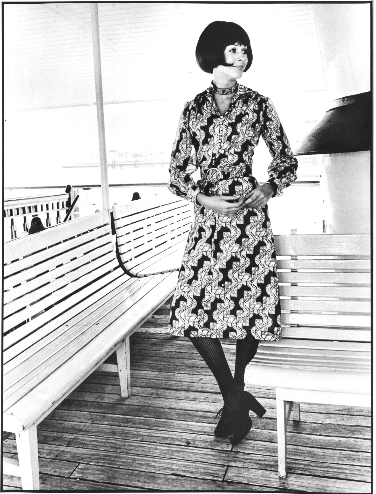
HAURY & CO. AG, ST. GALLEN Modisches, midilanges Chemisier-Kleid aus bedrucktem Voile.