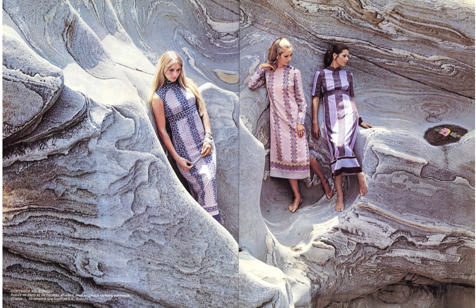
CORTESCA AG, ZÜRICH Robes de party et de cocktail allurées, avec originaux dessins panneaux. (Tissus: L. Abraham & Cie Soieries S.A., Zürich)