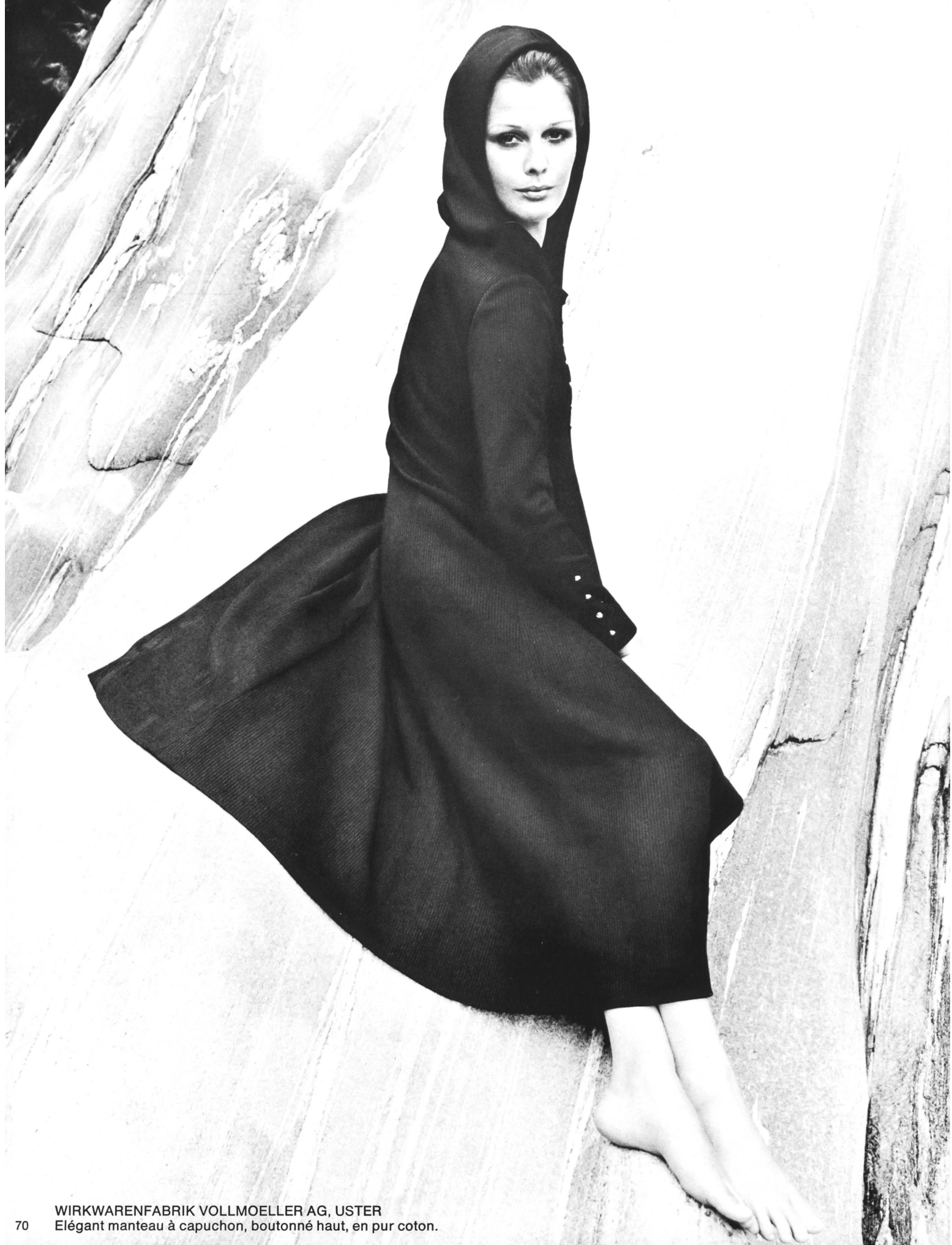
WIRKWARENFABRIK VOLLMOELLER AG, USTER Elégant manteau à capuchon, boutonné haut, en pur coton.