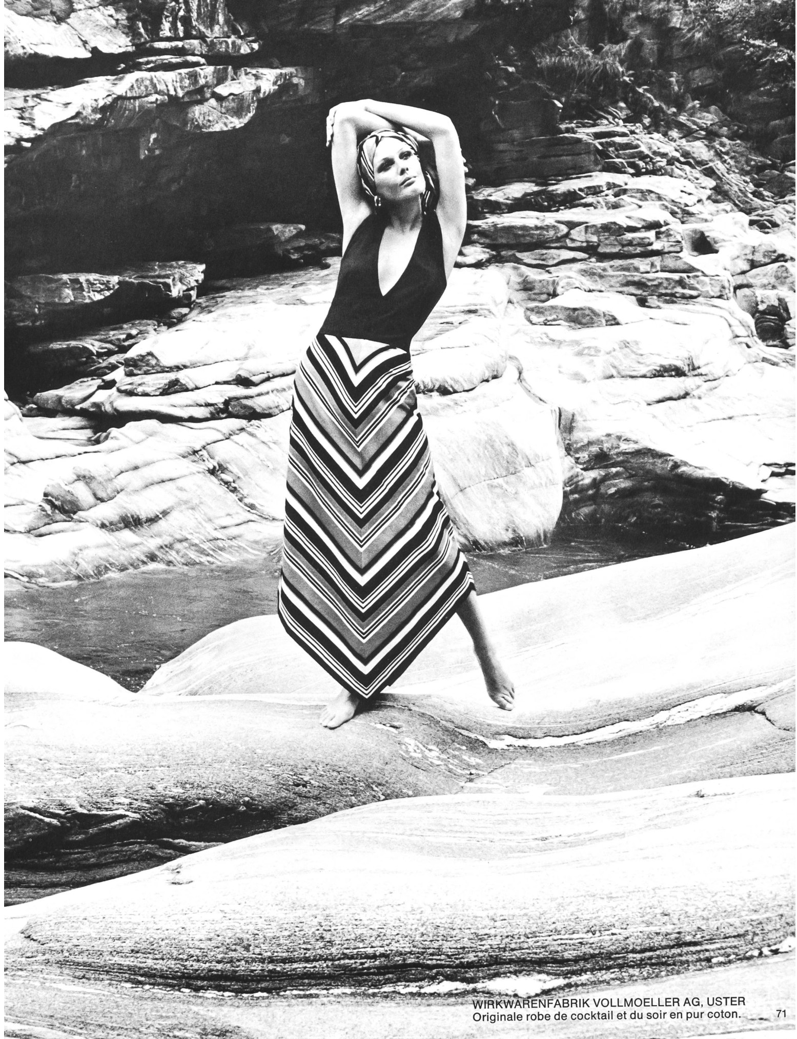
WIRKWARENFABRIK VOLLMOELLER AG, USTER Originale robe de cocktail et du soir en pur coton.