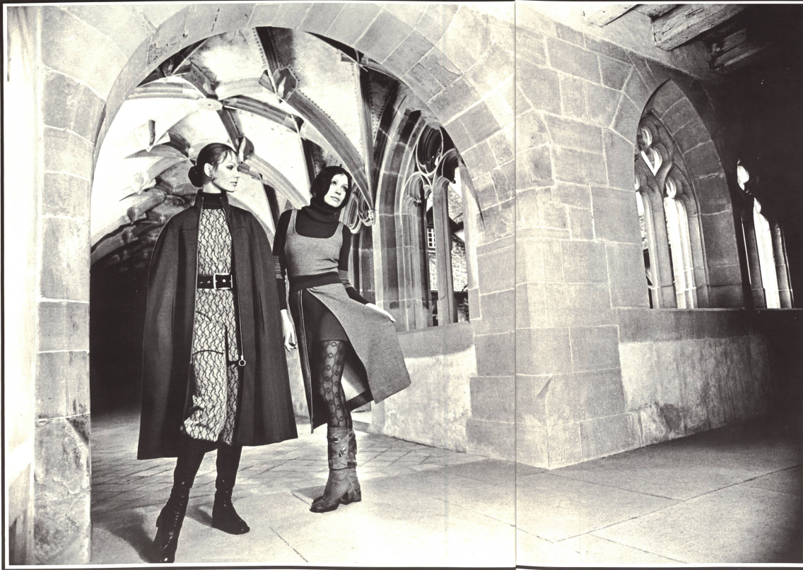
Zwei sportliche Ensembles aus 100% Wolltricot: Kasak mit Rollkragen und Caddy-Hose sowie Pullover mit Shorts, Jupe und Gilet; dazu ein zu beiden Modellen passendes Cape • Deux ensembles sport en tricot pure laine: casaque avec col roulé et knickers ainsi que pullover avec short, jupe et gilet; la cape peut se porter avec l'un et l'autre modèle • Two sporty outfits in 100% wool tricot: casaque with roll collar and caddy-trousers; pullover with shorts, skirt and cardigan; as well as a cape matching both models