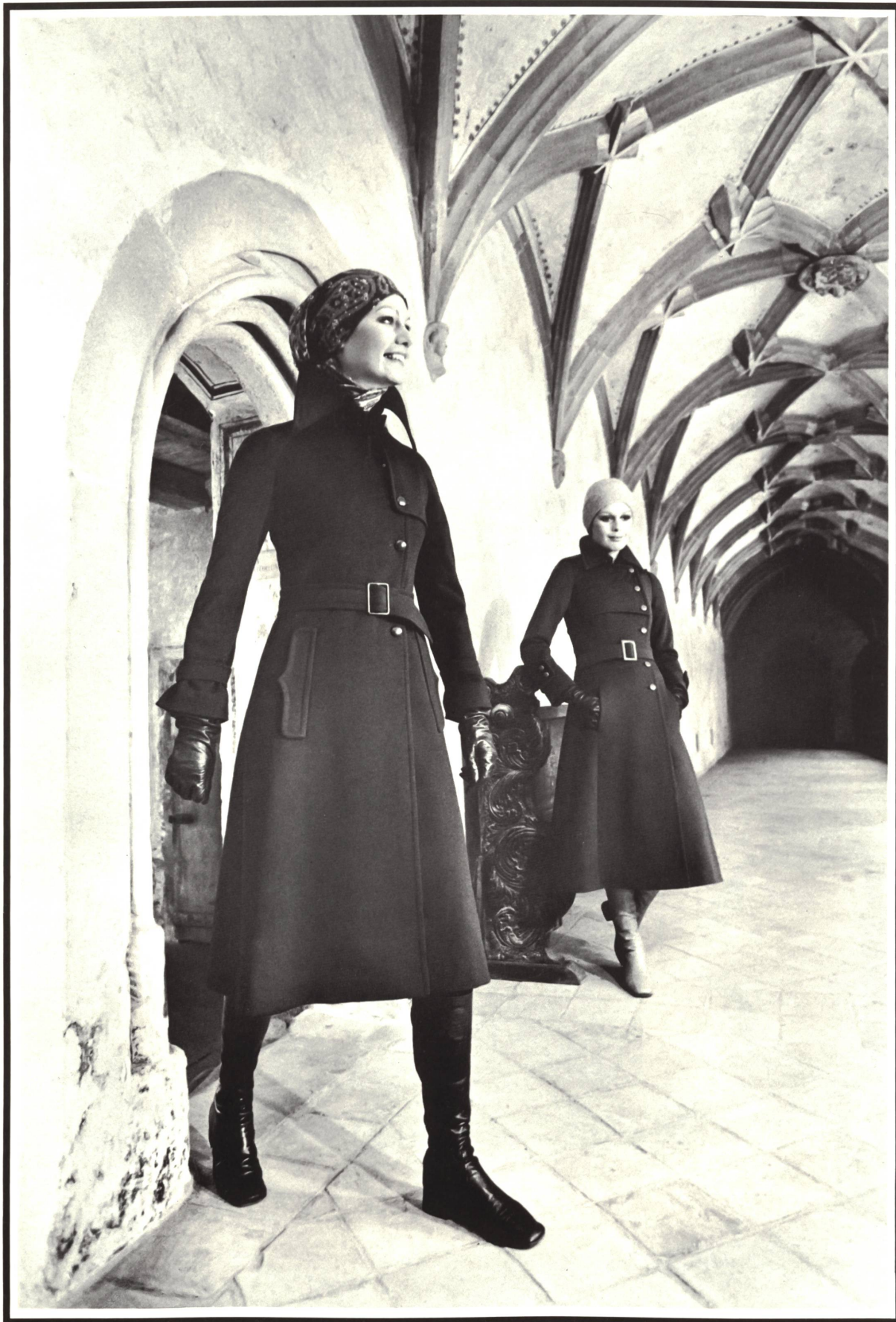
Zwei elegante Mäntel im sportlichen Genre aus reinem Schurwoll-Jersey • Deux élégants manteaux de genre sport, en jersey de pure laine vierge • Two elegant casual style coats in pure virgin wool