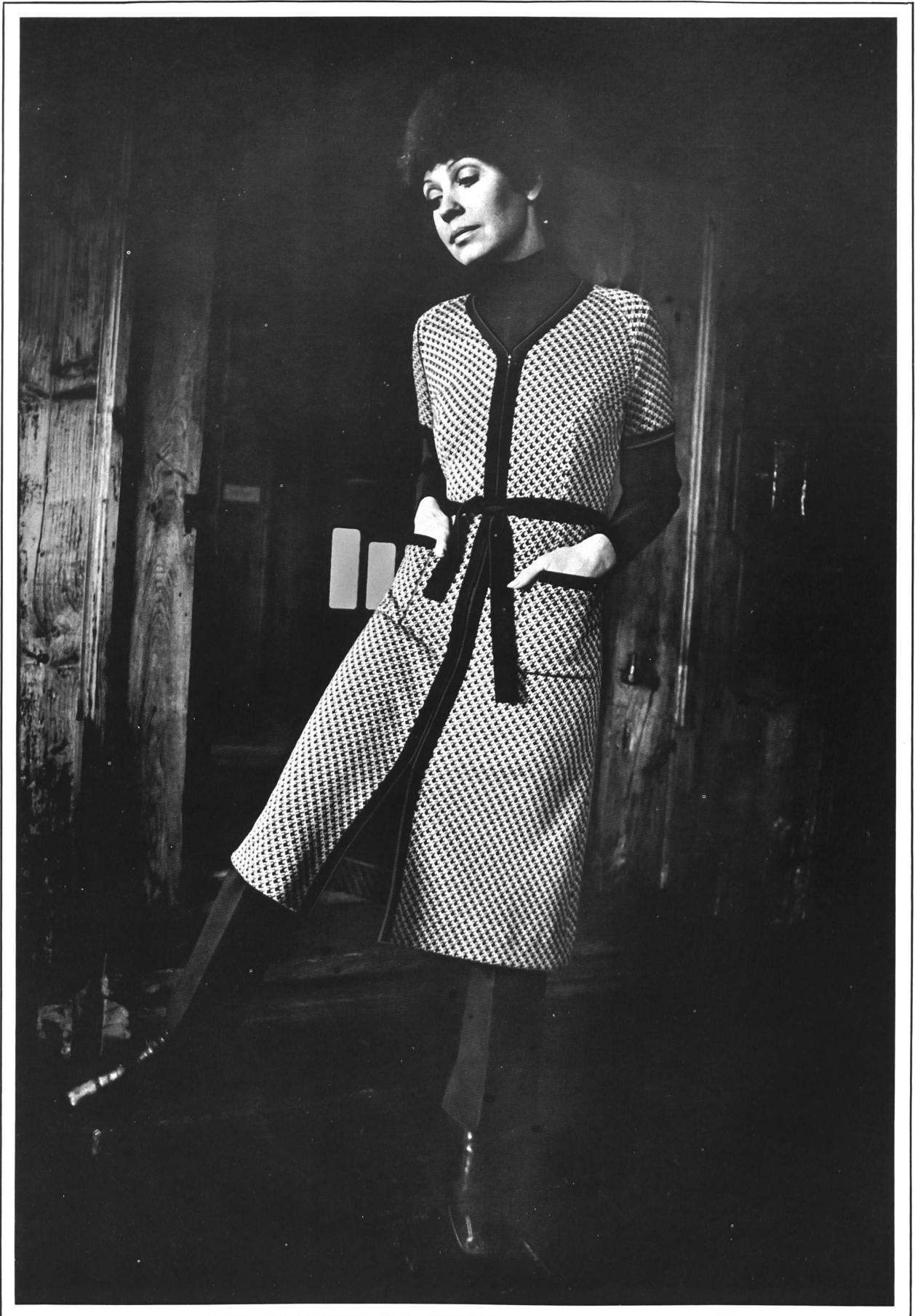
Midilanges, Jacquard-gestricktes Trois-Pièces aus reiner Schurwolle, mit uni Pullover • Trois-pièces midi en tricot jacquard, avec chandail uni, en pure laine vierge • Midi-length, jacquard knitted three-piece outfit in pure virgin wool, with plain pullover