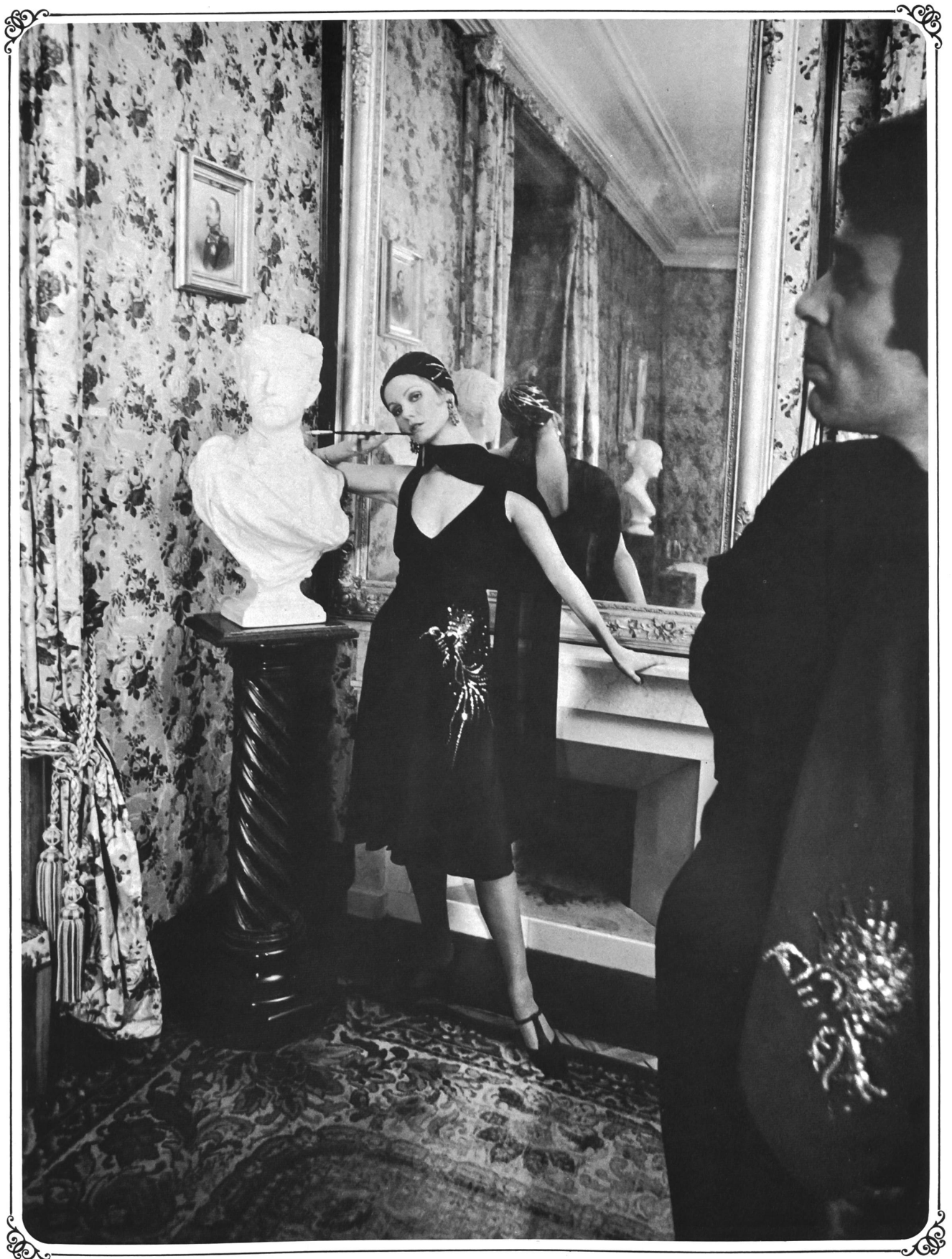
Schwarzes Cocktailkleid aus reinseidenem Crêpe de Chine und Krawatte, beide mit Pailletten in gleichem Motiv bestickt; Hemd aus schwarzem Seidenjersey • Robe de cocktail en crêpe de Chine noir, pure soie, et cravate, les deux articles avec broderie à paillettes dans le même motif; chemise en jersey de soie noir • Cocktail dress in black pure silk crêpe de chine and tie; both articles with spangled embroidery in the same pattern; black silk jersey shirt