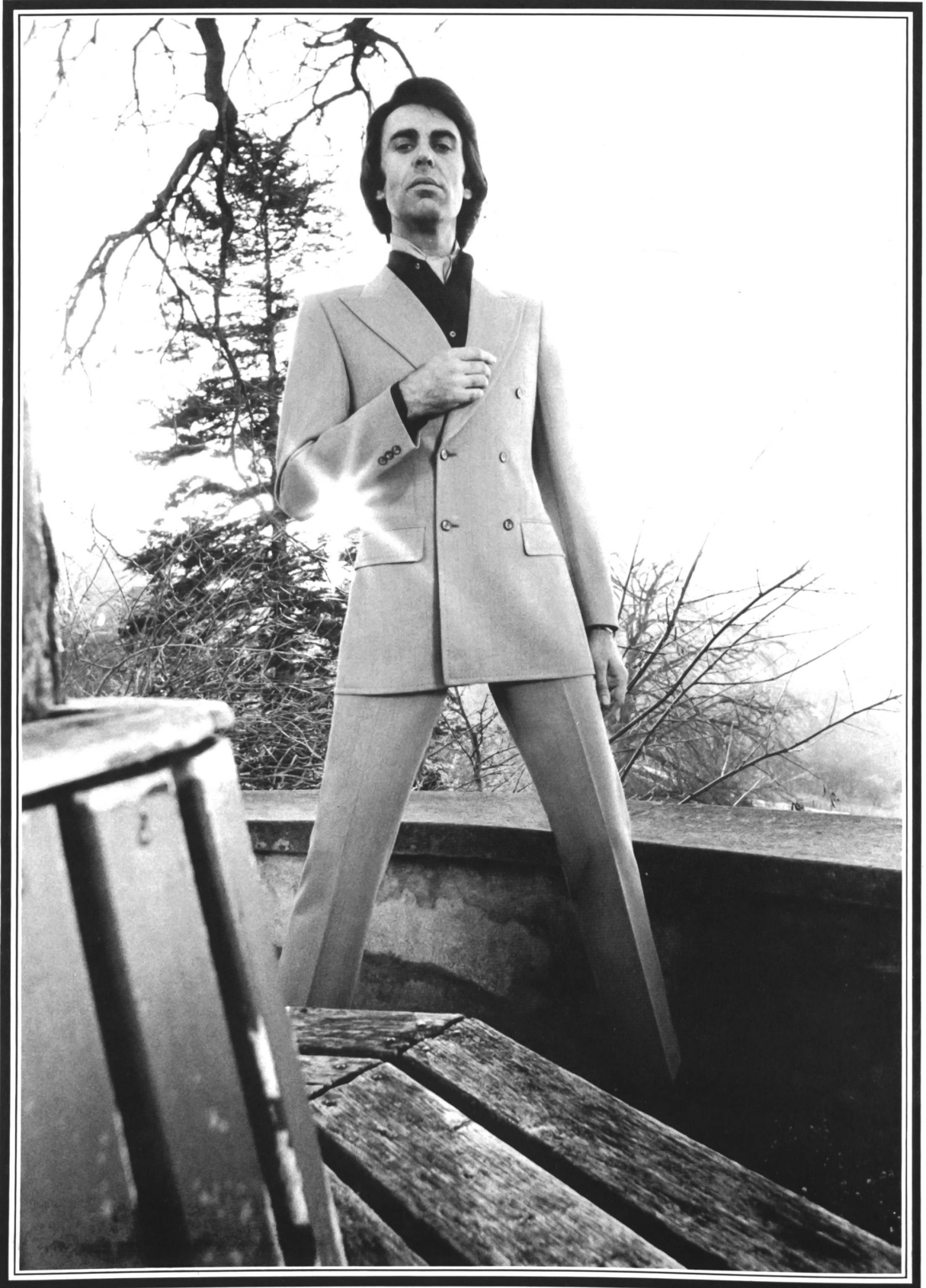
Eng taillierter zweireihiger Anzug aus Trevira®/reine Schurwolle, mit Seitenschlitzen, breitem, geschweiftem Revers und modischen Taschen • Complet croisé cintré, en Trévira® et pure laine vierge, avec fentes latérales, larges revers arrondis et poches mode • Snug double-breasted suit in Trevira®/pure virgin wool, with side vents, wide deeply cut lapels and fashionable pockets