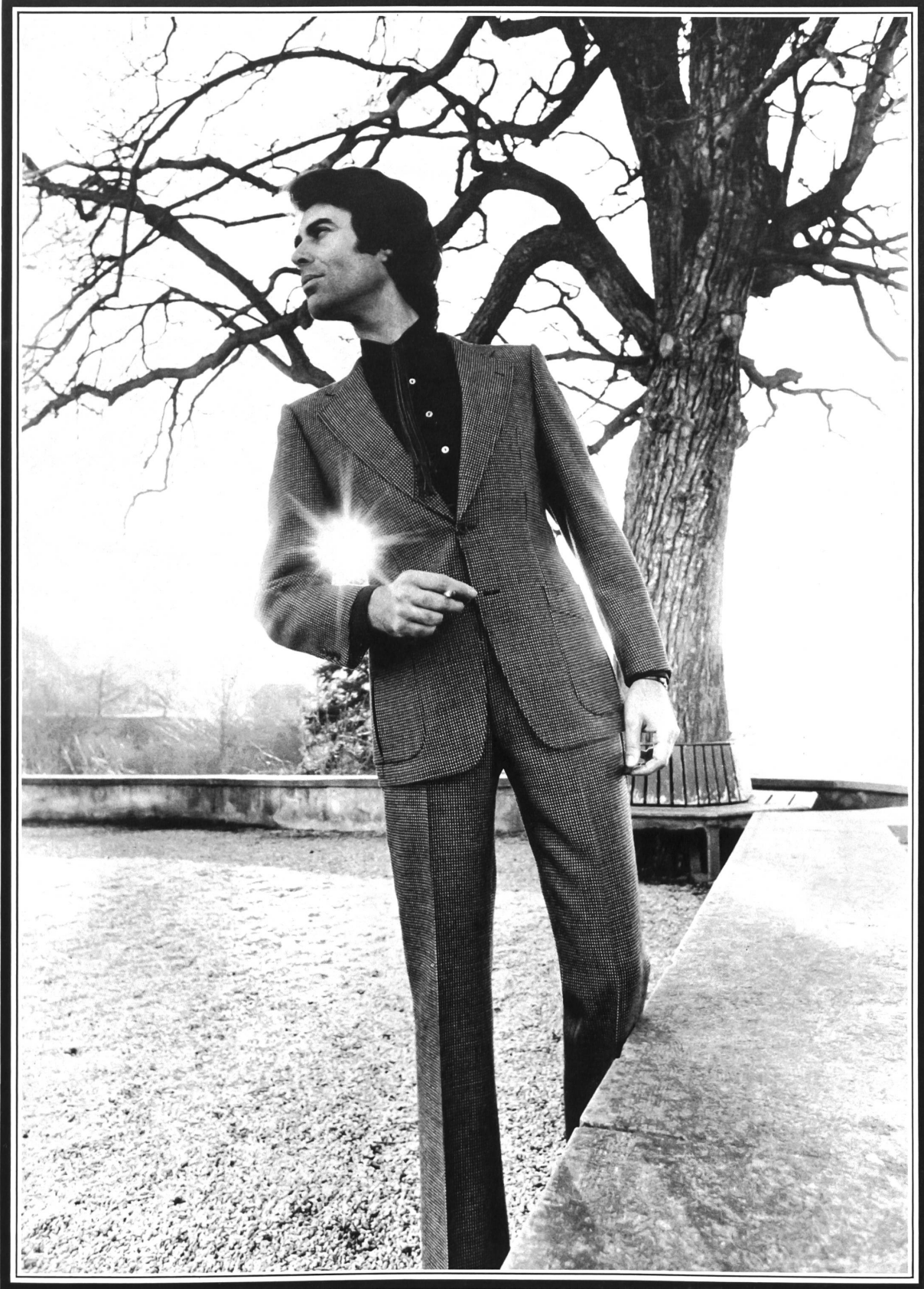
Sportlicher Anzug in schlanker Linienführung mit zwei aufgesetzten Taschen, gesteppter Rückennaht und Steppnähten; ein Modell aus Trevira®/reine Schurwolle in kleiner Dessinierung • Costume de sport de ligne élancée avec coutures piquées et poches appliquées; un modèle en Trévira® et pure laine vierge à petit dessin • Slinky sporty suit with stitched seams and appliquéd pockets; a Trevira® and pure virgin wool model in a small design