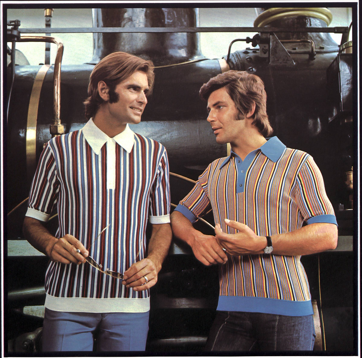
STRICKEREIEN ZIMMERLI & CO. AG, AARBURG Zwei Polo-Shirts aus 100% Baumwoll-Florzwirn links-links gestrickt in vier- bzw. fünffarbigem Streifen-Dessin.