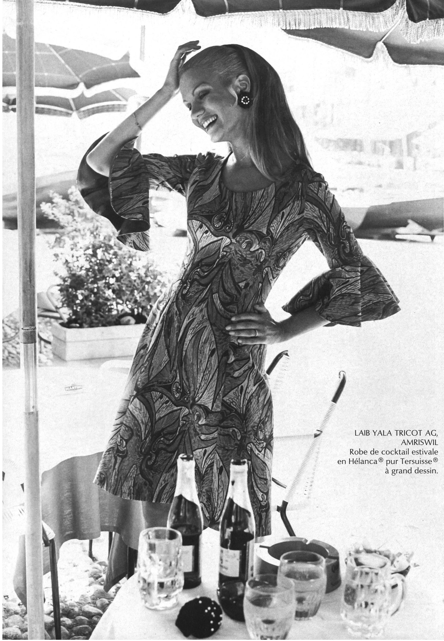
LAIB YALA TRICOT AG, AMRISWIL Robe de cocktail estivale en Hélanca® pur Tersuisse® à grand dessin.