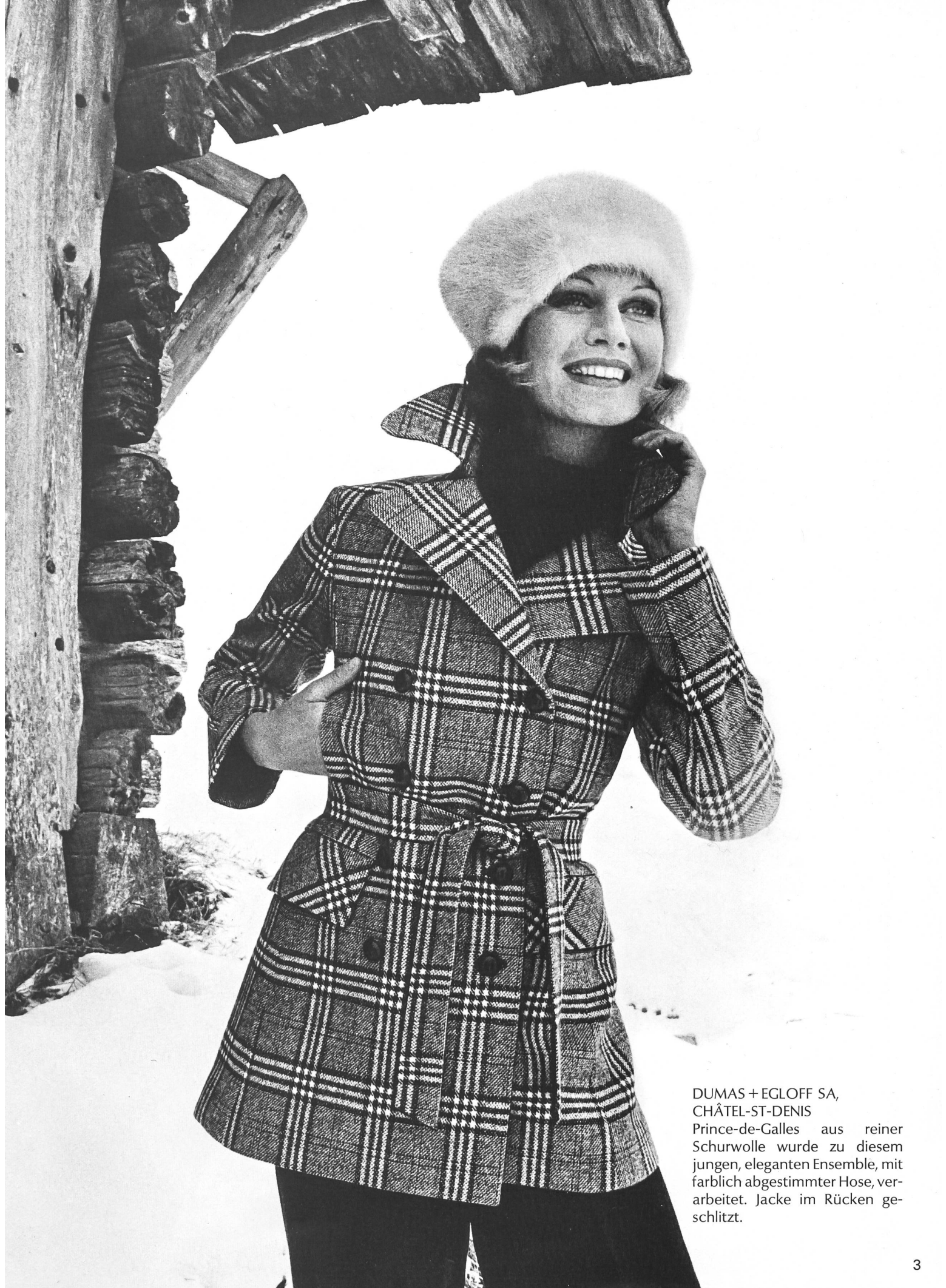
DUMAS + EGLOFF SA, CHÂTEL-ST-DENIS Prince-de-Galles aus reiner Schurwolle wurde zu diesem jungen, eleganten Ensemble, mit farblich abgestimmter Hose, ver- arbeitet. Jacke im Rücken ge- schlitzt.