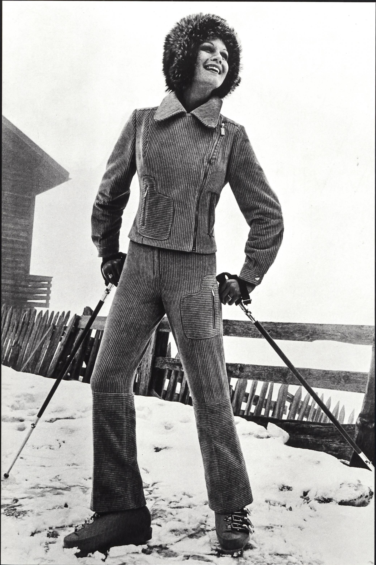
CROYDOR AG, ZÜRICH Eleganter Ski-Anzug aus elastischem Cord.