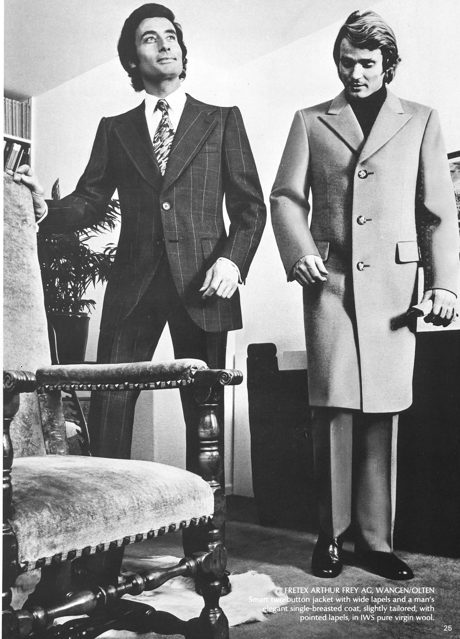
FRETEX ARTHUR FREY AG, WANGEN/OLTEN Smart two-button jacket with wide lapels and a man's elegant single-breasted coat, slightly tailored, with pointed lapels, in IWS pure virgin wool.