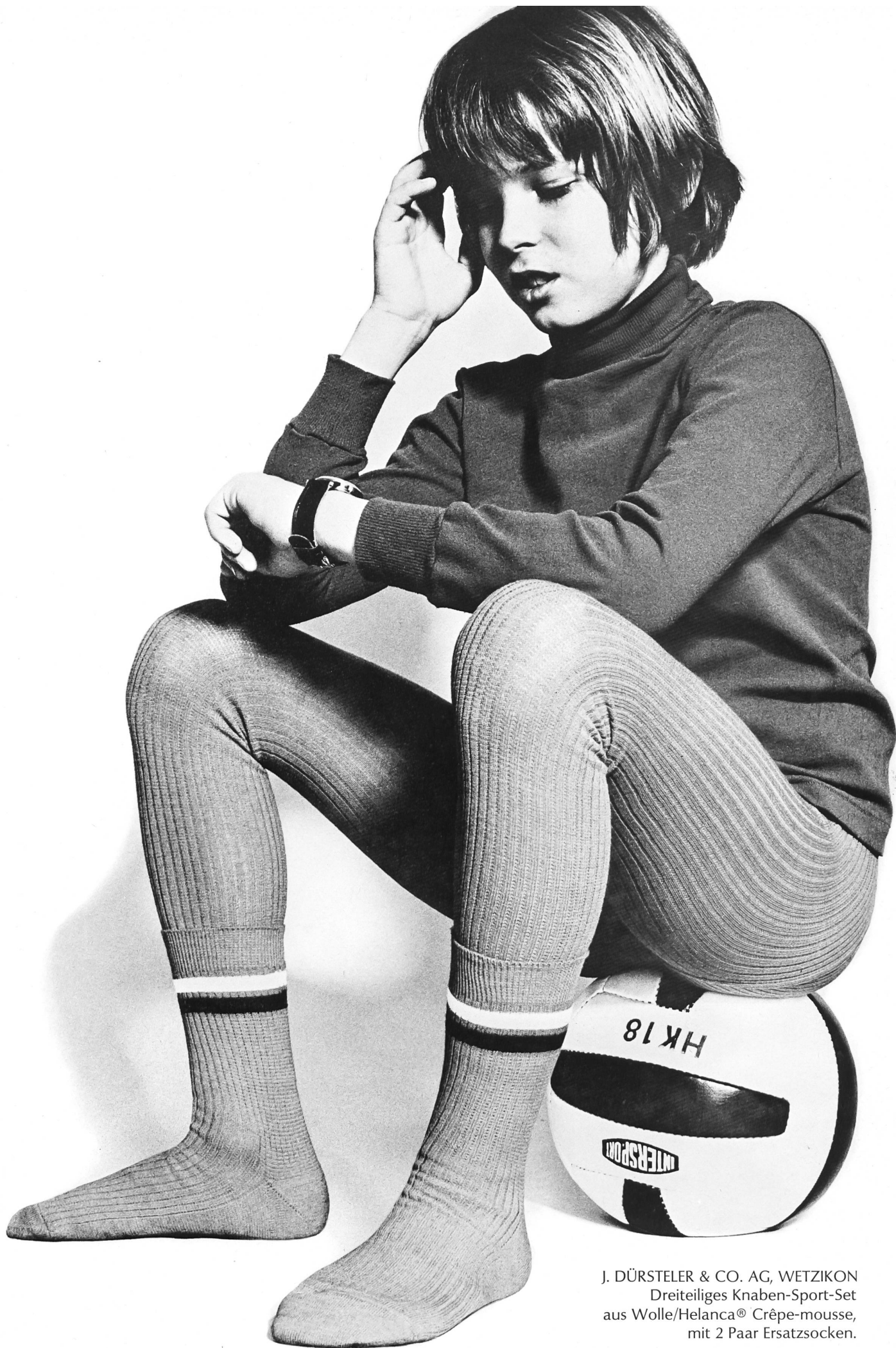
J. DÜRSTELER & CO. AG, WETZIKON Dreiteiliges Knaben-Sport-Set aus Wolle/Helanca® Crêpe-mousse, mit 2 Paar Ersatzsocken.