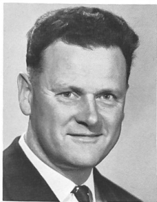
Harold Taeschler, Präsident der Schweizer Mode- wochen Zürich

Wir rechnen bei der 1. Messe mit ungefähr 80 ausländischen Teilnehmern, was uns erlaubt, absolut kostendeckend zu arbeiten. Aber auch schon mit 50 Anmeldungen sollte, meiner Meinung nach, das Unternehmen gestartet werden, damit ein Anfang gemacht wäre.»