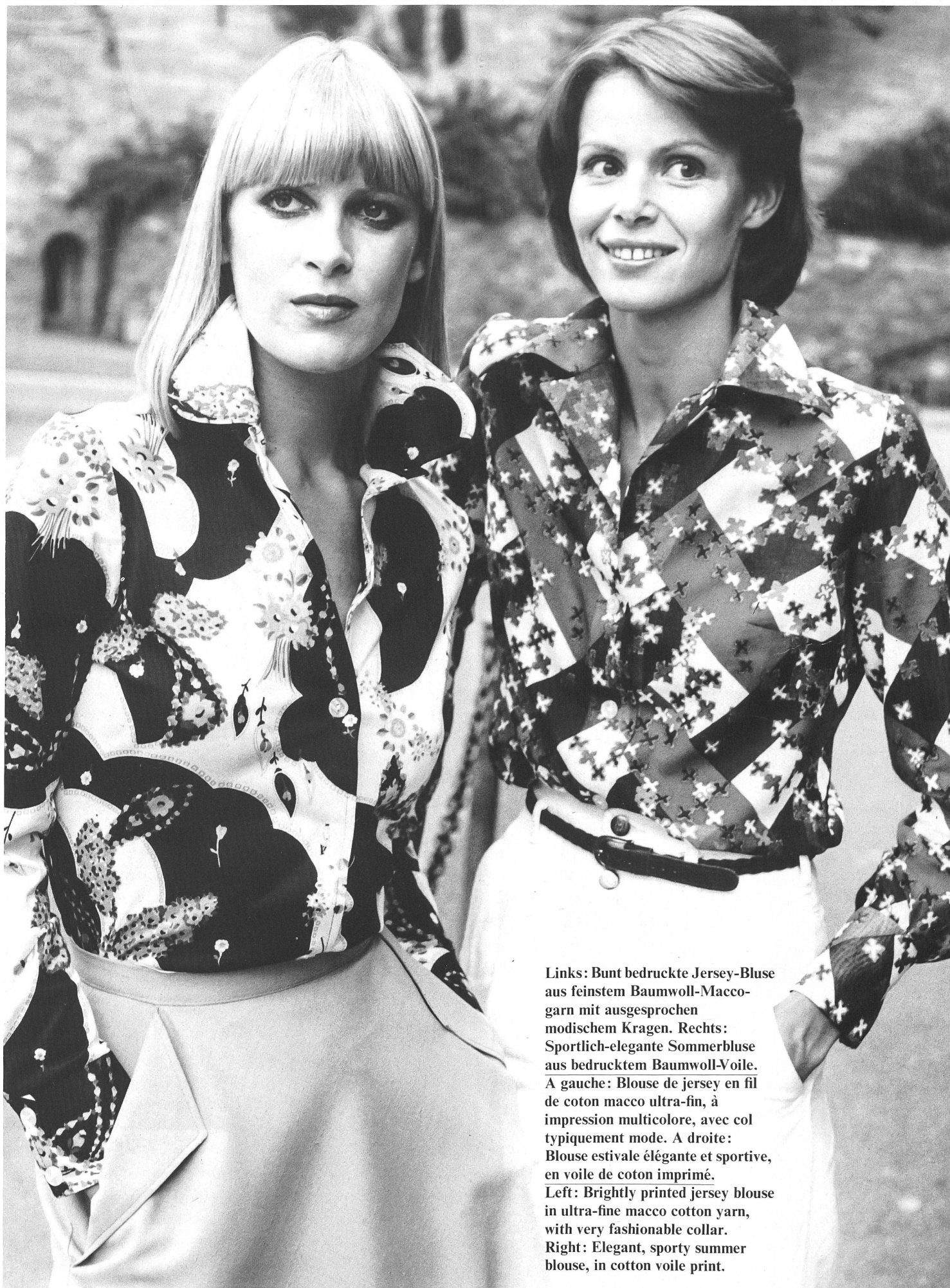
Links: Bunt bedruckte Jersey-Bluse aus feinstem Baumwoll-Maccogarn mit ausgesprochen modischem Kragen. Rechts: Sportlich-elegante Sommerbluse aus bedrucktem Baumwoll-Voile. A gauche: Blouse de jersey en fil de coton macco ultra-fin, à impression multicolore, avec col typiquement mode. A droite: Blouse estivale élégante et sportive, en voile de coton imprimé. Left: Brightly printed jersey blouse in ultra-fine macco cotton yarn, with very fashionable collar. Right: Elegant, sporty summer blouse, in cotton voile print.