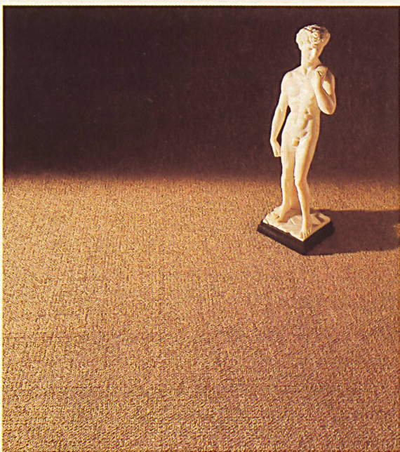
Alpina « Herkules »