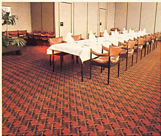
Exklusive Webteppiche nach Mass

Im grosszügig gebauten Diana-Zentrum des Raiffeisenhauses in Wien liegen Melchnauer Teppiche aus reiner Schurwolle (Wollsiegel-Qualität), teils dem modernen, äusserst reichhaltigen « Wilton »-Sortiment entnommen, teils jedoch ganz nach speziellen Dessin- und Farbwünschen des Architekten Schalleck auf genaues Mass gewoben.