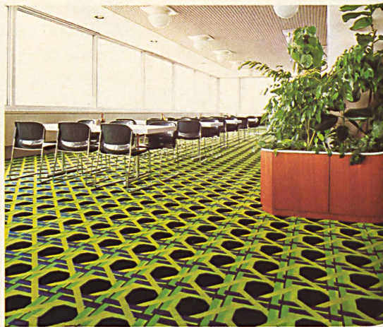
Tappeti tessuti esclusivi su misura

Nel grandioso Centro Diana della Casa Raiffeisen di Vienna si trovano tappeti di Melchnau di pura lana vergine (la qualità marchio lana), in parte provenienti dal moderno e copiosissimo assortimento « Wilton », in parte però tessuti esattamente su misura secondo speciali desideri dell'architetto Schalleck per quanto riguarda il disegno e il colore.