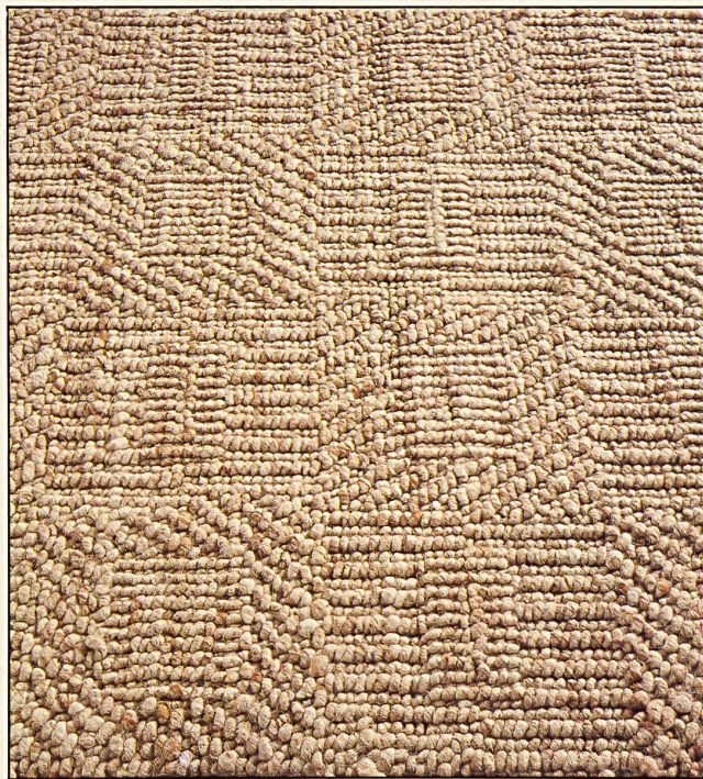
Tisca "Quadro", 442, pure new wool (Woolmark quality)

Tisca Textile Works, located at Bühler/Switzerland, has just launched "Quadro", another novelty in the field of high quality virgin wool carpets. The creative idea behind the design, which is based on the effect created by old stone walls or arrangements of natural stone-paving, is governed by the desire to give free rein to the possibilities offered by the very full wool yarn. In this new line, Heini Seger, the firm's chief designer, wanted to use the natural look of the material to emphasize the structure of the weave, as well as satisfy the highest modern standards of comfort in the home. "Quadro" is available in the soft natural colours of wool — light, medium and dark beige and brown — and comes in 7 fine variations of the same basic design, which are nevertheless quite different from each other and have an extremely quiet and pleasant look. In the standard version, "Quadro" comes in a 4 meter width, all other patterns are produced in lengths one meter wide. After the