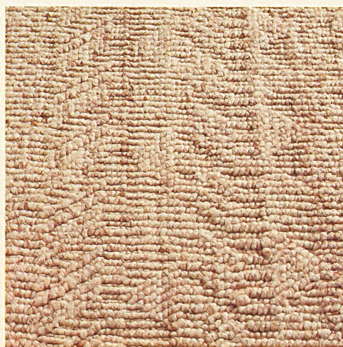
Tisca "Quadro", 444, pure new wool (Woolmark quality)

Erstmals an der Messe in Frankfurt wird zudem der aus reiner Schurwolle (Wollsiegel-Qualität) hergestellte Tisca «Tweed» vorgestellt, eine klassische, vom Berber her abgeleitete Auslegeware mit typischer Tweedstruktur, die in den immer noch aktuellen Naturfarben, aber auch in einem sanften Grau sowie in zweifarbigen Versionen mit modisch ansprechenden Farbkombinationen angeboten wird.