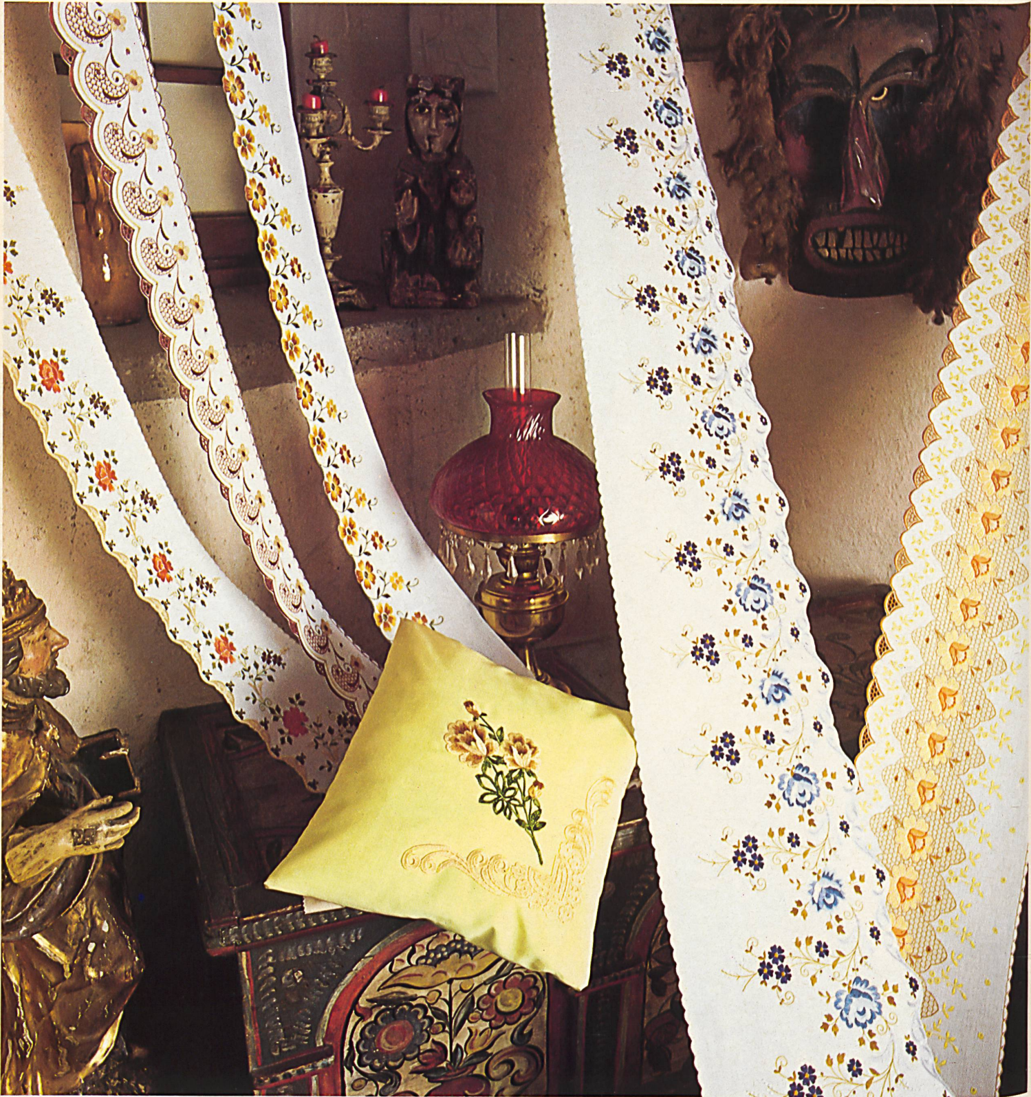
Early 18th century mask from the Loetschentel.

Multicoloured embroidered borders for stylishly modern bedlinen. The floral motifs are set off by playful geometric designs. Heat-applied self-toned combinable embroideries, washable in boiling water.