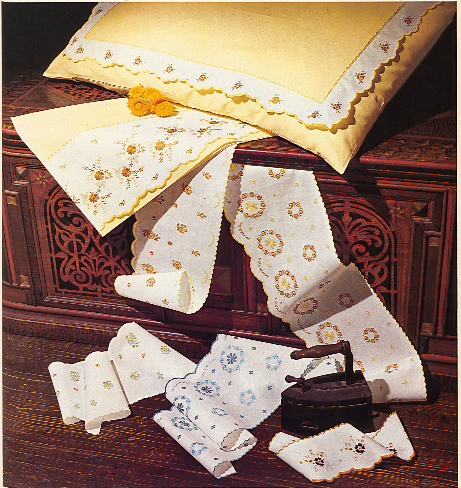
Wide choice of coloured embroidery braids and bands in various widths for trimming pillow-cases and bedsheets. All are notable for the fine finish of the embroidery, made by various processes, on pure cotton edges.