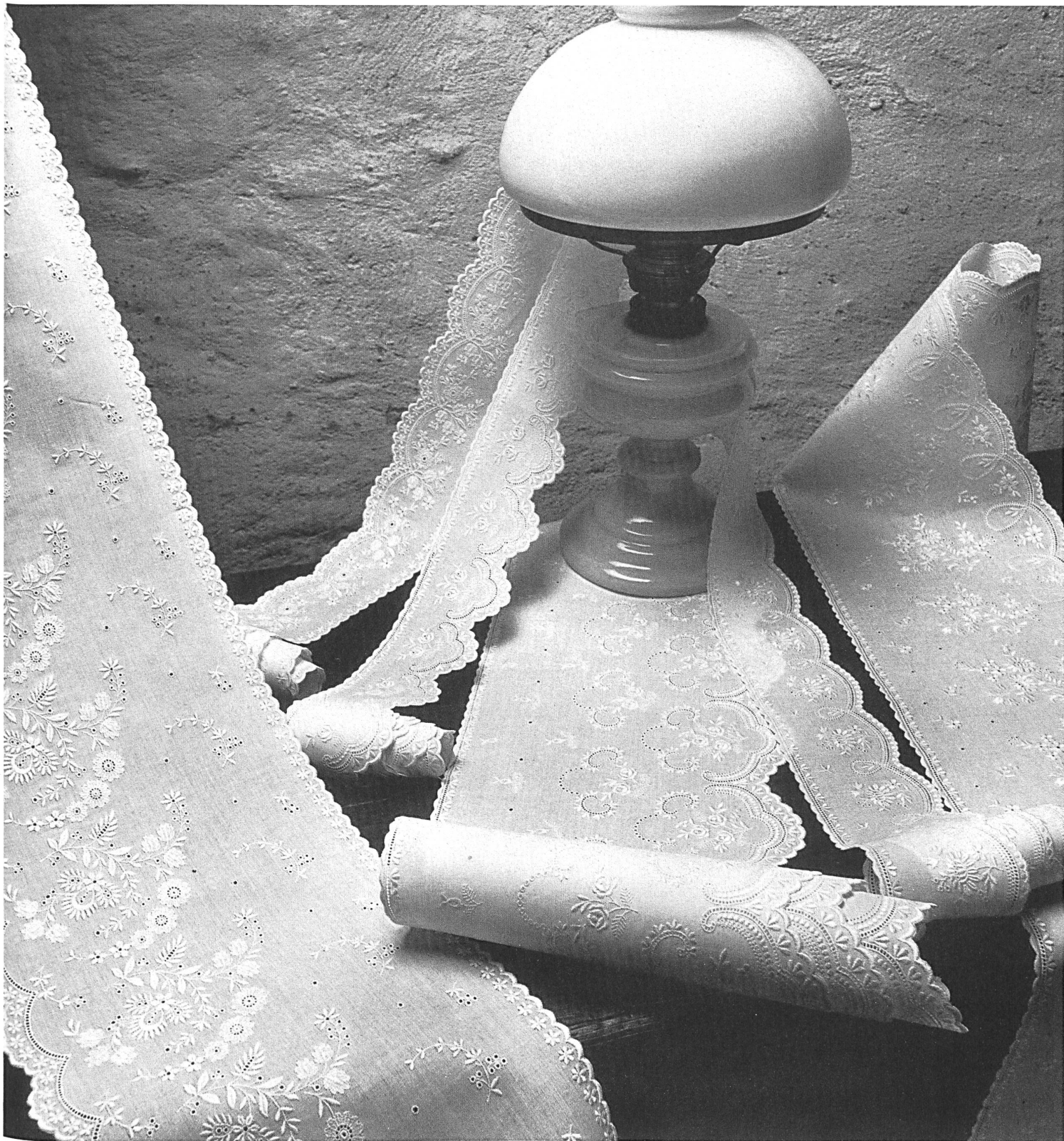
Classically elegant embroidered borders for traditional white trousseaus. The rich embroidered patterns are essentially floral in inspiration. Various widths for matching sheets and pillow-cases.